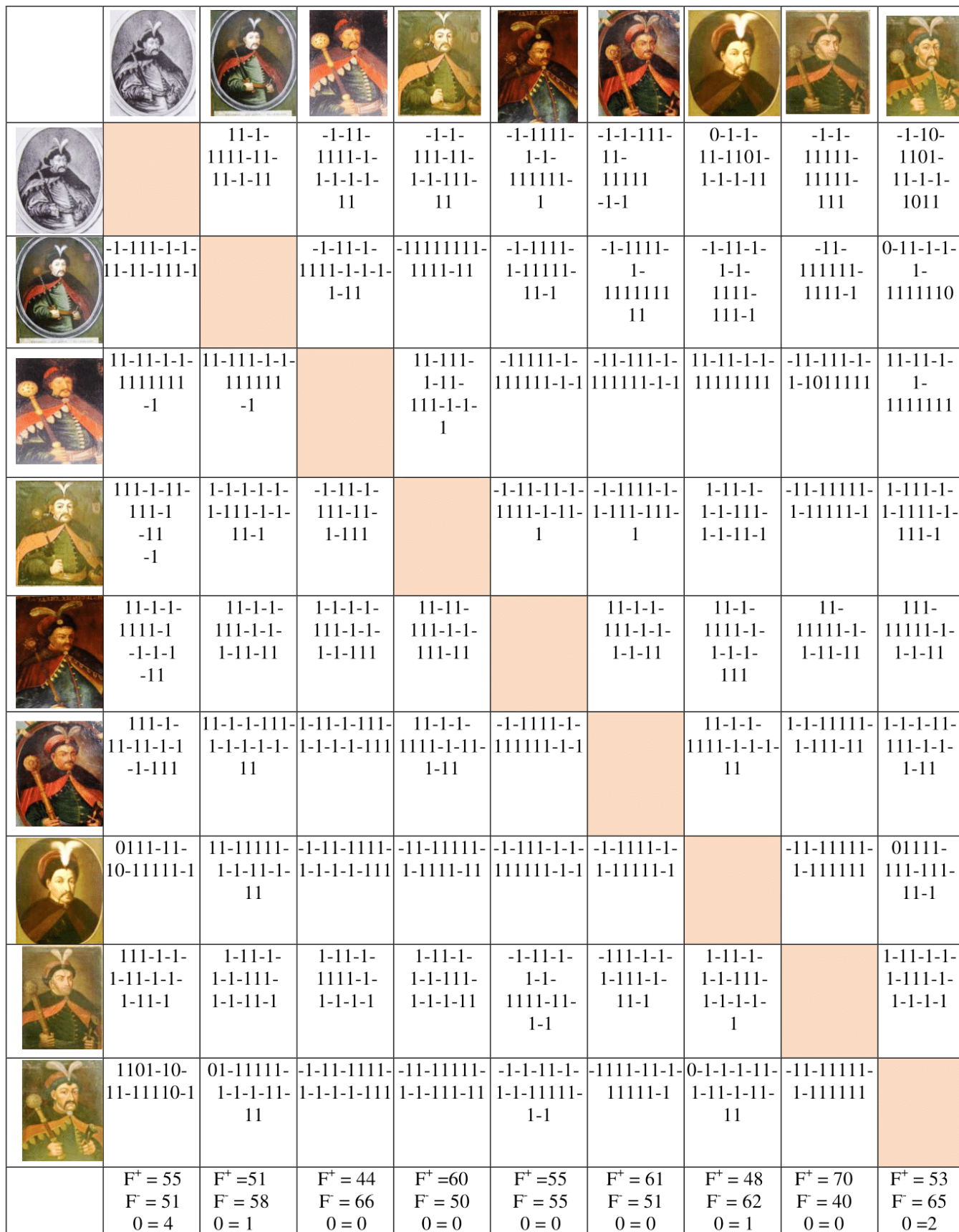
Таблиця 3. Результати обліку позитивних та негативних відповідей в процедурах порівняння.