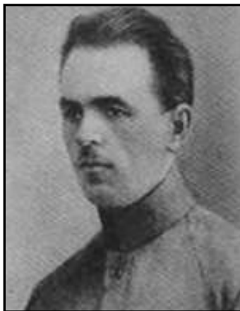
Григорій Колос (Колосов), командувач Повстанськими військами УНР