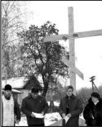
Відкриття пам'ятного знака Жертвам Голодомору в Зеленівці

З 1990-х років на Чернігівщину спорадично приїжджають німці, щоб поклонитися землі предків. У Зеленівці дивом зберігся католицький костел, в 1934 р. комуністи знесли куполи, а будівлю переобладнали під клуб і кінотеатр, добудувавши котельню. В якості сільського клубу давній костел і дожив до на-