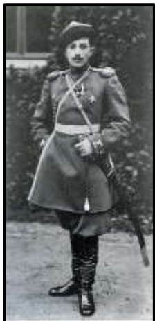
Князь М. С. Путятін

Підносячи зразки білизни, одна з учениць сказала: «Прийміть, Матінко-Цариця, для поранених воїнів». Інша дівчинка піднесла від майстерні два українських кралевецьких рушники зі словами: «Царю і Вам, Государиня».