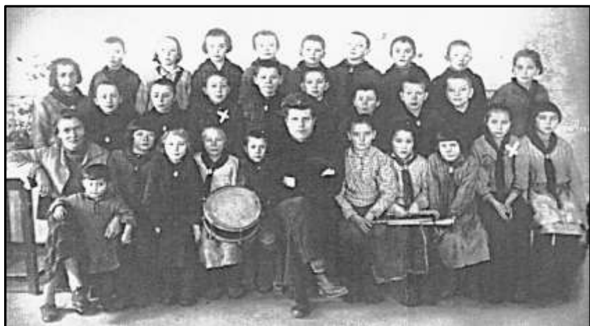
Випускний клас чотирирічної школи в Білих Вежах. 1936 р.