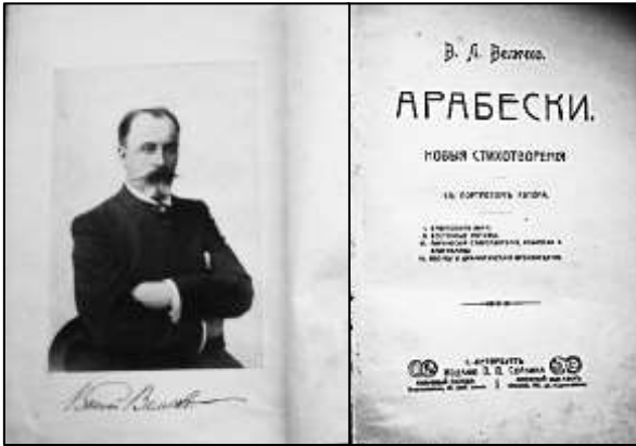
Останній збірник віршів В. Величка «Арабески». 1903 р.

Літературні критики відзначали «безсумнівне і велике поетичне обдарування автора». Поет увійшов до антології П. П. Перцова «Молода поезія», виданої в 1895 р.