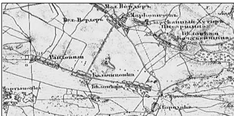
Біловезькі колонії на мапі Шуберта 1868 р.

Пізніше адміністративний центр колоній перемістився в Кальчинівку, яка стала волосним центром Борзнянського повіту.