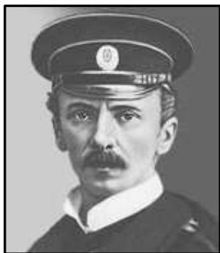
Петро Петрович Шмідт

Лейтенант Шмідт приїжджав у Романівщину напередодні свята Івана Купала в 1905 р. Петра Шмідта захопило це народне свято: палаючі вогнища на широкій дорозі серед лісу, танці під музику місцевих музикантів, стрибки через багаття, від яких і він сам не зміг втриматися, катання на білому човні по освітленому місячним світлом озеру, в якому плавали кинуті сільськими дівчатами ритуальні вінки. Вислухавши пафосні промови друга, Катерина відповіла йому настільки ж піднесено: «Це Україна і її душа! І ніщо не може бути більш піднесеним для мене, ніщо мене не розлучить з нею!».