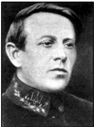
Головний отаман Симон Петлюра