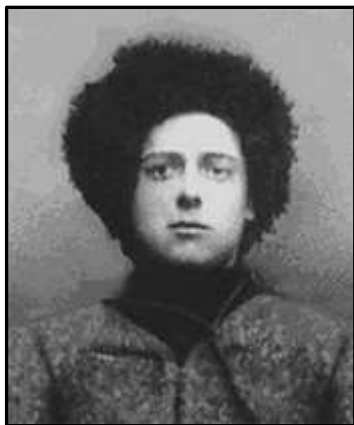
Отаман Зелений (Данило Терпило)

Після цього бою його загін розділювався на кілька частин – частина козаків повернулася додому, а інші, розбившись на дрібні групи, передислокувалися в прилуцькі та ічнянські ліси. Ангел з невеликим загonom (60 козаків) 3 травня 1919 р. перейшов на правий берег Дніпра і влився до загону отамана Зеленого.