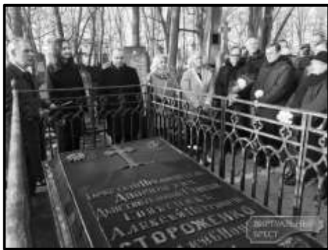
Відкриття поховання О. П. Стороженка після реконструкції. 24 листопада 2017 р.

Роботи з реставрації надмогильного пам'ятника були завершені в листопаді 2017 р., а 24 листопада, в день народження Олекси Стороженка, синхронно зі святковими заходами в Ічні,