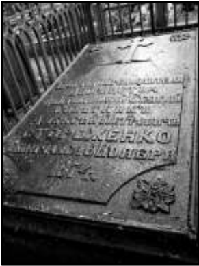
Плита на могилі О. П. Стороженка

Українці Бреста опікувалися й могилою письменника. У 1920-х роках могила просіла, в цегляному склепінні над труною утворився отвір. Стараннями української громади, на заклик інженера Івана Гноевого, могила була впорядкована, а навколо плити поставили металеву огорожу.