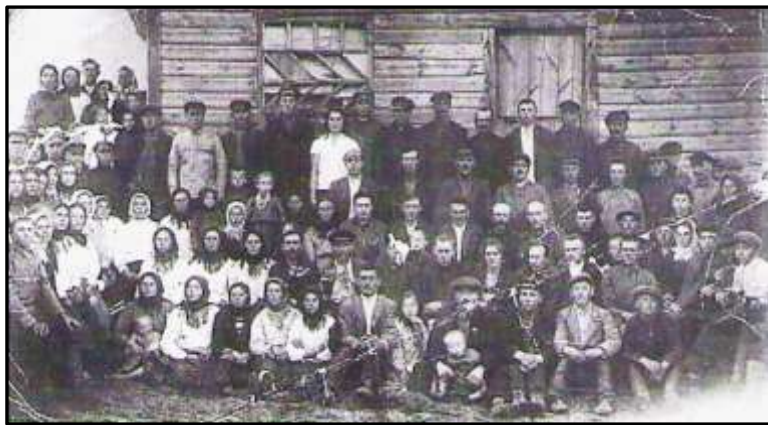
Кращі колгоспники Білих Веж і Городка. Жовтень 1933 р.

Лютеранські села перенесли голод легше, хоча й там мала місце нестача продовольства через спущені зверху нереальні плани хлібозаготівель. У колгоспах було відкрито їдальні, харчі перепадали і членам сімей, позначилися також заможність і хазяйновитість німців.