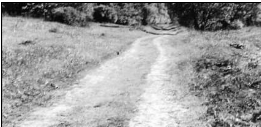
Сучасний вигляд дороги між Білими Вежами і Городком