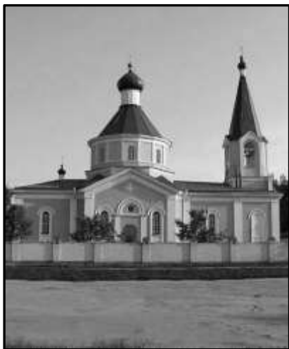
Миколаївська церква на Сорочинцях. Прилуки, вул. Шкільна, 1