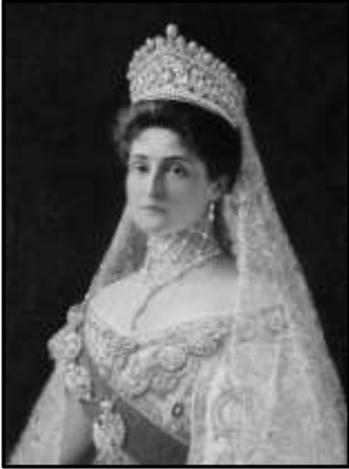
Імператриця Олександра Федорівна

коронації імператора Миколи II і імператриці Олександри. Богослужіння здійснювали Санкт-Петербурзький, Київський і Московський митрополити, п'ять єпископів і понад 50 священнослужителів. На богослужіння зібралися всі вищі чини Російської імперії.