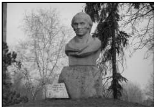
Пам'ятник Івану Мартосу в Ічні. Скульптор В. Луцак, архітектор І. Сидоренко

Пам'ять про знаменитого скульптора Івана Мартоса дбайливо зберігається на його малій батьківщині у місті Ічня на Чернігівщині. Іван Мартос є гордістю місцевих жителів, його називають генієм із Ічні, 1980 р. вдячні ічнянці встановили йому пам'ятник в центрі міста, а до 225-річчя від дня його народження про життя і творчість скульптора було знято документальний телевізійний фільм. Є в місті і вулиця Івана Мартоса.