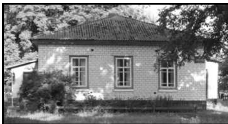
Приміщення жіночої школи в Хасенках. Сучасний вигляд

догмати, заповіді і статуту в ході церковної служби, на практиці навчався здійснювати церковні таїнства і наставляти свою паству, вислуживши священицький сан після 19-ти років бездоганного церковного служіння.