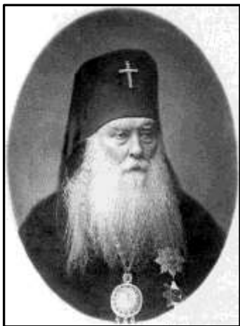
Архієпископ Димитрій (Муретов)