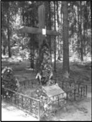
Пам'ятний знак українцям, похованим у Левашово