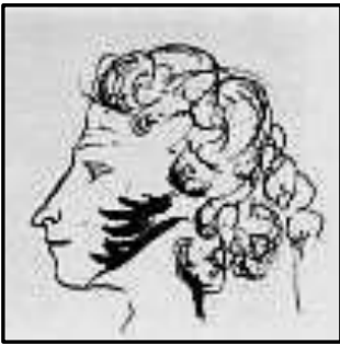
О. С. Пушкін. Автопортрет

«Кинувши погляд на спинку дивана, я мимоволі помітив над нею цей портрет, намальований пером на моєму папері, а коли я його показав своїм людям, то всі визнали в ньому схожість з тим паном, який був ... Для мене стало ясным, хто був мій дорогий гість».