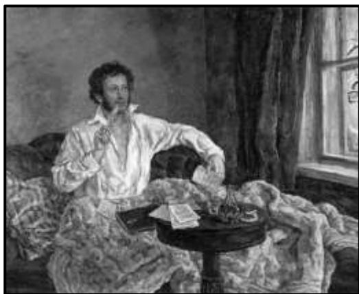
Пушкін в Михайлівському. Художник П. Кончаловський, 1840 р.

Також слід згадати, як був одягнений Пушкін під час поїздки. На ньому були жовті нанкові шаровари і зім'ята червона сорочка російського крою, підв'язана не те арапником, не то витертою шийною хусткою. А. І. Подолинський у листі до рідних писав про зустріч з поетом: «Пушкін видався мені при зустрічі в Чернігові схожим на свого бідно одягненого слугу ... ». Якщо врахувати ще й зовнішність Пушкіна, то дворецький навряд чи впізнав у ньому пана, і в будинок би не пустив.