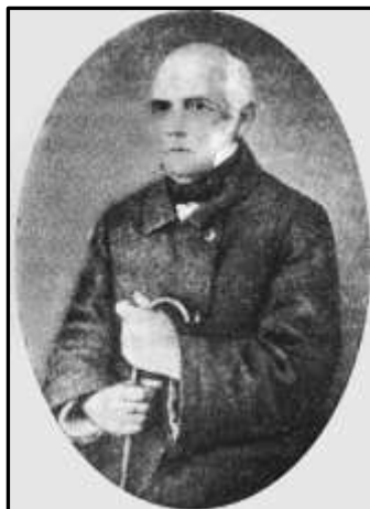
Платон Андрійович Кулаковський