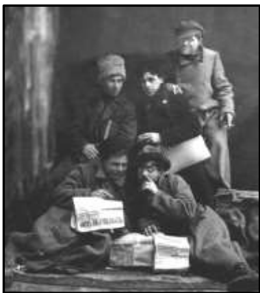
Гурт з Ангелом. Євген Ангел в центрі. 1918 р.

Дієвим інструментом поповнення «Куреня смерті» була вдала агітація. Ангел був дуже популярним серед сільського населення свого повіту і губернії як захисник селян і, не в останню чергу, завдяки зовнішньому шарму й успіху в жінок. Його зовнішність описують так: високого зросту, брютет, схожий на грузина. Підполковник Середа писав про зовнішність отамана Ангела: «В його чорних великих очах завжди палали вогники невичерпної енергії та рішучого характеру. Його жилага, рухлива постать завжди перебувала в напрузі всіх м'язів, вимагаючи постійно гострих вражень і мінливих рухів». Чи у Романа Ковалю: «...Гарний, стрункий, чорнявий отаман» або «красунь».