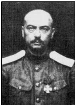
Яків Юзефович, командувач 5-м кінним корпусом Добровольчої армії