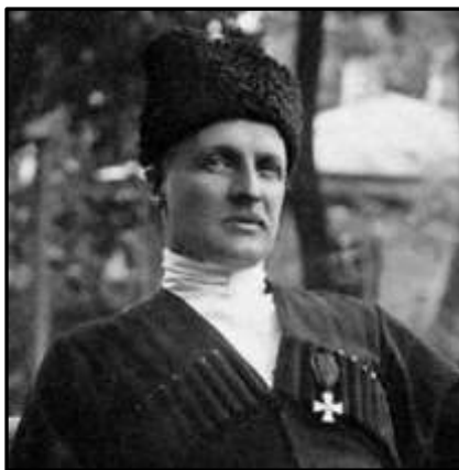
Гетьман Української держави Павло Скоропадський