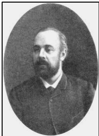
Всеволод Федорович Міллер