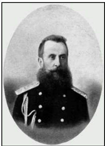
Генерал-лейтенант В. Г. Золотарьов

Тривала і різноманітна служба В. Г. Золотарьова була відзначена багатьма орденами, включаючи орден Білого Орла, і чином генерал-лейтенанта, присвоєним у 1884 р.