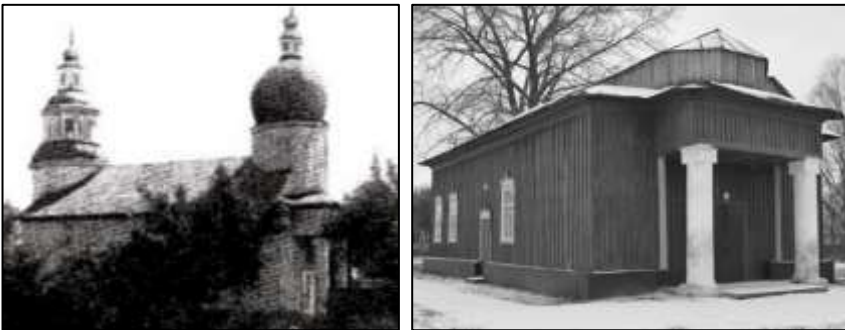
Костел у Великому Вердері. Фото початку ХХ ст. і сучасний вигляд

Церква тривалий час підпорядковувалася Гомельському