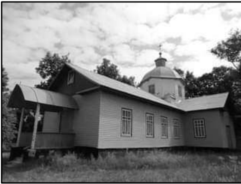
Церква Святої Параскеви в Бурімці. Збудована 1868 р. замість церкви, яка згоріла в пожежі 1866 р.

Дитячі роки та юність Олексія прийшлися на трагічний період історії Бурімки, як і всієї України: колективізація, розкуркулювання, голодомор,