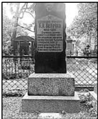
Могила К. І. Величка на Нікольському цвинтарі

В 1905 р. К. І. Величко одружився вдруге, дружину звали Єлизавета Василівна (уроджена Томас).