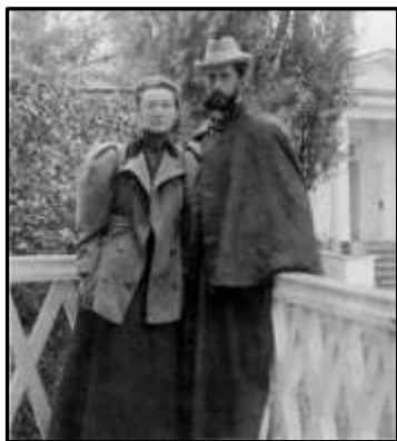
Князь Олександр Дабіжа і княгиня Софія

Але незабаром Олександр Дабіжі довелося перервати дипломатичну службу і піти у тривалу відпустку. У Каїрі загострилася важка хвороба – туберкульоз, клімат Єгипту був для нього нестерпним. Лікувався в санаторіях Німеччини та Швейцарії, але зусилля лікарів виявилися марними, і Олександр Дабіжа повернувся в Росію.