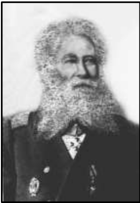
Віктор Резанов Вільна, 1880-ті роки

Тож довелося працювати над усуненням «вузьких місць» у біографії художника. Пошуки інформації про В. Резанова в різного роду дореволюційних документальних та історичних джерелах, матеріалах Академії мистецтв, приватному листуванні, адрес-календарях, художньо-мемуарних творах, а також у скупих відомостях з анотацій до робіт художника в музеях та на мистецьких аукціонах і в згадках про нього в окремих публікаціях дозволили заповнити наявні прогалини та неточності його біографії.