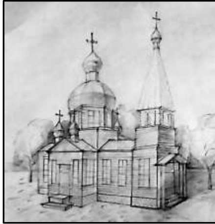
Церква Іоанна Богослова в Хасках. Реконструкція В. Козловської