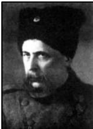
Борис Палій-Неїло, полковник армії УНР