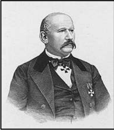
Олекса Петрович Стороженко

епізодів його життя, сумнівні твердження і навіть помилки. Поява помилок часто обумовлена хибним трактуванням відомих фактів та некритичним використанням відомостей, які спочатку подавалися окремими біографами лише як припущення, а в подальших публікаціях уже стали наводитись як доведені факти.