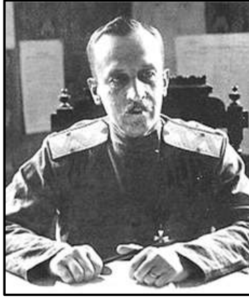
Ніколай Бредов, генерал-лейтенант, командувач 7-ю піхотною дивізією Добровольчої армії