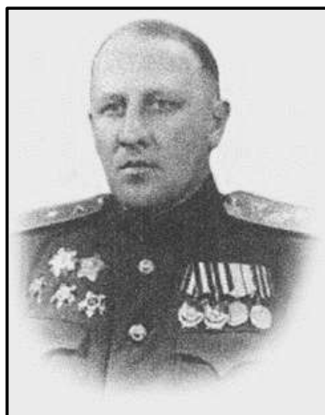
Юрій Гаврилович Богдашевський, генерал-майор артилерії