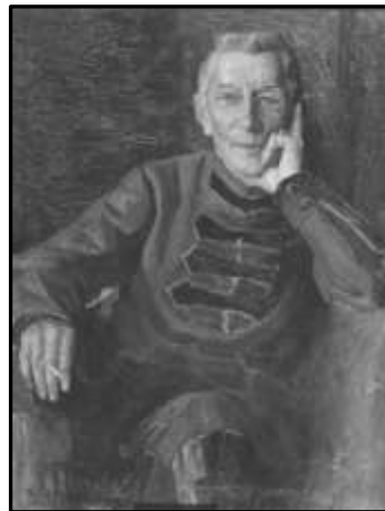
Портрет К. І. Величка. Художник С. І. Пічугін, 1927 р.