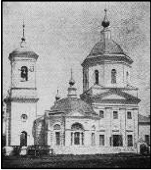
Знаменська церква в садибі Каріан

Про інших сестер відомостей знайти не вдалося.