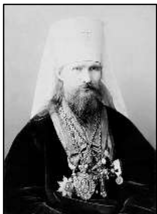
Митрополит Московський Володимир

каря та прислугу і виділили для екскурсій по Москві місцевого дякона.