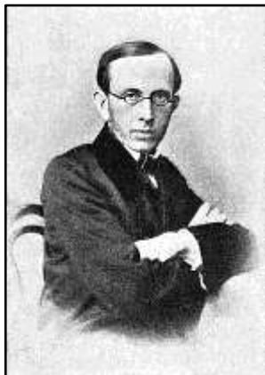
Обер-прокурор К. П. Побєдоносцев

Далі делегація вирушила до Москви, її проводжав з напутнім словом протоієрей Соколов, обдарувавши всіх на прощання духовними книгами. У Москві делегація розмістилася в гуртожитку Московського єпархіального жіночого училища, де їм надали стіл, лі-