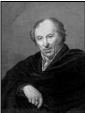
Іван Петрович Мартос. 1819 р. (художник О. Г. Варнек)

На початку 2018 р. в Державному Історичному музеї Москви проходила виставка, присвячена 200-річчю пам'ятника Мініну і Пожарському. Монумент був встановлений на Червоній площі і урочисто відкритий 20 лютого 1818 р. в присутності імператора Олександра І.