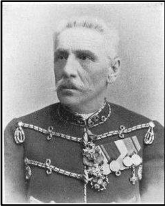
І. І. Величко-молодший

Як і батько, Іван Іванович Величко-молодший (1829–1911) обрав військову кар'єру. Закінчив 1-й Петербурзький кадетський корпус, військову службу розпочав у Ризькому драгунському полку, брав участь у поході російської армії в Угорщину