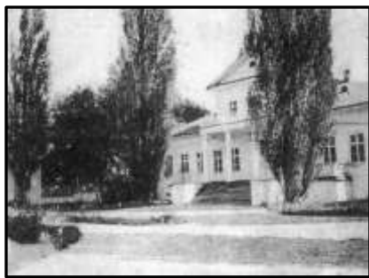
Палац Горленків-Дабіж у Романівщині

Письменник Степан Васильченко, який ще дитиною їздив разом зі своїм батьком до лісу за дровами, так значно пізніше опише побачене в дитячому віці: «Ці будинки зразу виявили себе перед моїми очима, як марево дивне серед дикої краси, марево з далеких невідомих країв. Веранда з колонами, великі вікна, строгі й красиві лінії будови, вся тая невидана, велична архітектура, перед якою відразу помарніли й почорніли в думці всі найкращі хати в нашому селі, до болю вдарила мене і схвилювала, що дух забило...».