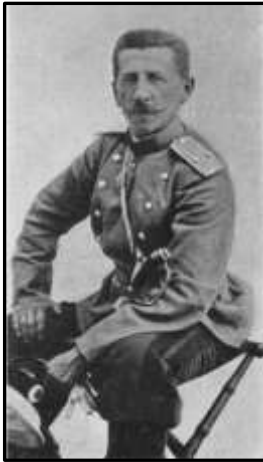
К. І. Величко. Маньчжурська армія, Ляоянь, 1904 р.