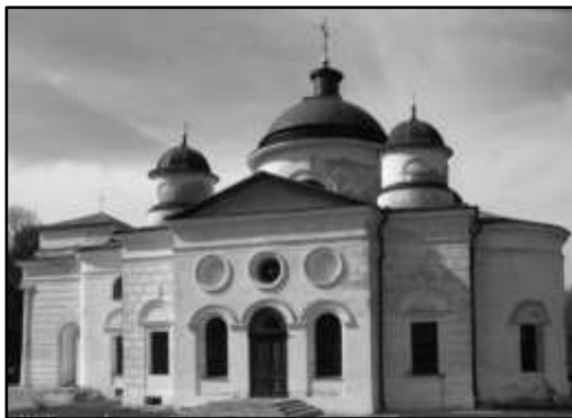
Церква Георгія Хозевіта в Качанівці. Сучасний вигляд