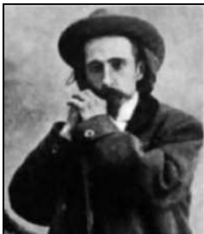
Фердинанд Георгійович де Ла Барт