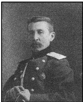
Генерал К. І. Величко.

Народився 20 травня 1856 р. в Корочі Курської губернії (нині Білгородська область), помер 15 травня 1927 р. в Ленінграді (нині Санкт-Петербург).