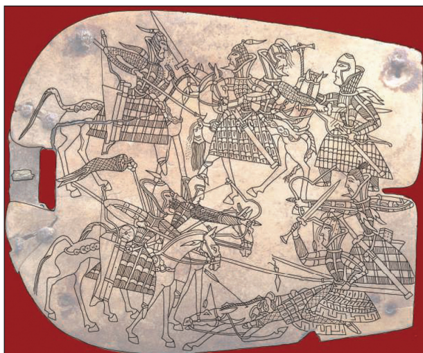
Рис. 5. Орлатська пластина, різьба по кістці, I—II ст. н. е.

Окремо у іконографії сарматського кола стоїть Орлатська пластина, датована I—II ст. н. е. На відміну від попередньо цитованого візуального матеріалу, там зображення колективного збройного зіткнення, що називається в акції, із застосуванням чисельного арсеналу зброї. Положення правої руки одного з комбатантів, озброєного списом, дало підстави декому із дослідників стверджувати побутування техніки таранного бою кушованим списом у середовищі кочових азійських племен.