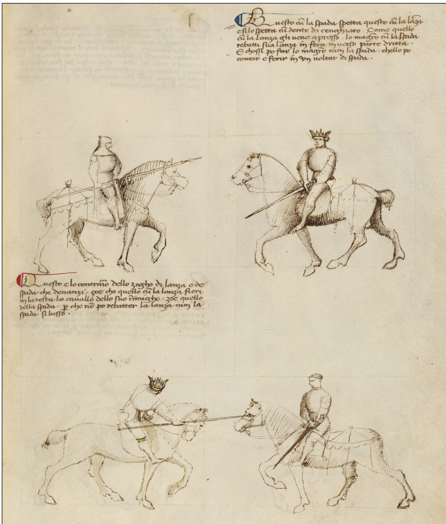
Рис. 2. Фіоре деї Лібері, «Fior di Battaglia», fol 43 r, манускрипт, початок XV ст.

Докладна аналогія «сарматської посадки» відтворена у рукописі початку XV ст. латинській версії трактату італійця Фіоре деї Лібері, котра відома під назвою «Florius de arte luctandi» — «Квіми бойового мистецтва» (рис. 1). Зображений зліва вершник, позначений короною майстра на голові, тримає спис горизонтально двома руками (права ззаду на деревці, ліва — спереду) з правого боку. Прийом підписаний так. «Обома руками я міцно тримаю спис посередині. Ти не встигнеш відбити мою атаку і твій кінь загине, отримавши смертельну рану» (Leoni, Mele 2018, р. 86—87). Очевидна різниця у алюрах коней натякає на те, що вершник із списом рухається повільно, натомість вершник з мечем атакує на швидкому алюрі, тому «летальний удар» в голову коня буде завдано не в таранній манері, але випадом. Власне, цей фрагмент трактату Фіоре дає чітке уявлення про варіативність застосування правостороннього дворучного хвату списа верхи. Подібний випад зображено на fol 43 r іншого рукопису цього трактату, що зберігаєть-