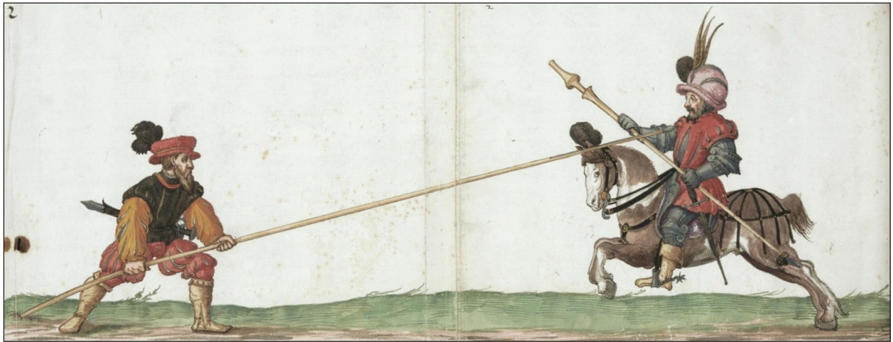
Рис. 3. Паулюс Гектор Маєр, «Opus Amplissimum de Arte Athletica», манускрипт fol 269 v, 1542 р.

Зустрічається в європейській традиції кінного бою в обладунку і опис та зображення діагонального та дворучного хвату списа, про який пише Юнкельман. Його теж описує Маєр, проте прийом є запозичений із фехтбуху Паулюса Кайля, котрий жив в середині — другій половині XV ст. Маєр пише про прийом так (рис. 4): «Коли ваш противник вклав свій спис до аррету, тоді зачепіть свій повід на нижній гак свого обладунку і візьміть спис обома руками