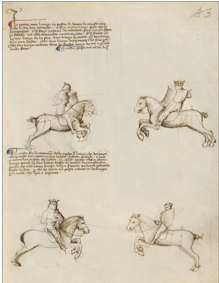
Рис. 6. Фіоре деі Лібері, «Fior di Battaglia», fol 41 r, манускрипт, початок XV ст.

користувався зображальними прийомами, відмінними від тих, що застосовані на батальній сцені. Правий вершник досягає противника мечем на близькій дистанції. На зображенні ясно помітно, що клинок після січного удару вгруз у шолом. Натомість лівий вершник вчиняє докладно те саме, що радять фехтувальні майстри XV—XVI ст. — атакувати не вершника, а коня. Якого вражає списом, утримуваним під пахвою.