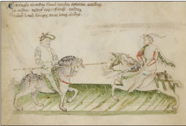
Рис. 1. Фіоре деї Лібері, «Florius de arte luctandi», fol 2 v, манускрипт, початок XV ст.

удару, причому з однаковим успіхом комбатант може міняти місцеположення рук на деревці. Найкраще лівосторонню стійку з винесеним вперед лівим плечем, ногою та рукою передає Пауль Гектор Майер у латиномовній версії свого трактату «De Arte Athletica», (створеному в середині XVI ст.), хоча за його ілюстрацією і рекомендаціями стоїть давня традиція, котра