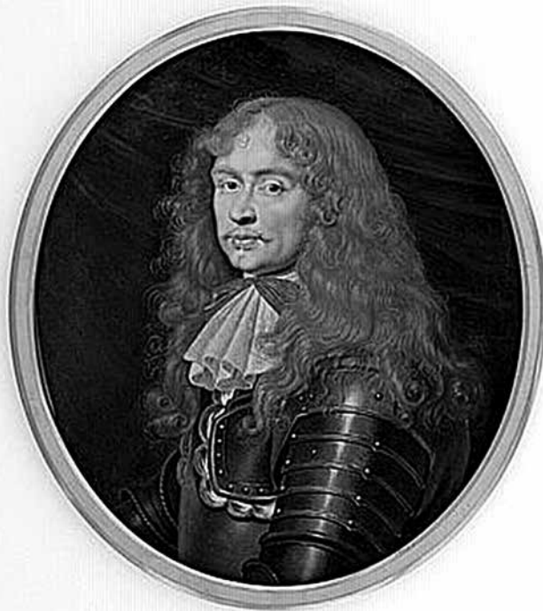
Рис. 1. Портрет Богуслава Радзивілла. Мініатюра на пергаменті невідомого майстра. XVII ст. 14 × 12 см. Париж, Лувр, № RF 205.

та Нідерландах, в середовищі, звідки ранньомодерна дуельна традиція імпортувалася в найвіддаленіші куточки християнського світу. Князь Богуслав, потужний литовський аристократ, хорунжий великий литовський (від 1638 р.) конюший великий литовський (від 1646), генеральний намісник прусський (від 1657 р.) як у польській історіографії так в популярній культурі дотепер є «чорним», негативним персонажем. Його біографія (кальвінізм, демонстративний перехід на шведський бік під час так званого Потопу, що не зовсім безпідставно вважався зрадою, демонстративне нехтування рацією Речі Посполитої на користь власних інтересів, і врешті показове «відособлення від польської культури») постачала тамтешнім історикам резон ігнорувати цю історичну постать, а польським митцям - матеріал до творення образів на зразок негативного персонажу роману Генріка Сенкевича «Потоп». У польській історіографії за останніх півтора сторіччя з'явилася небагато текстів присвячені князю Богуславу. Вартує уваги монографія Бернарда Каліцького [18] та об'ємний біографічний нарис авторства Тадеуша Василевського, що відкриває критичне видання князеві «Автобіографії» [11, с. 5-119]. Проте в Західній Європі, ця, за виразом професорки Карен Фрідріх «правдива транснаціональна фігура», викликає чим далі тим більше інтересу.