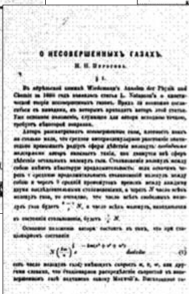
Праці М.М. Пирогова

На жаль, праці М.М. Пирогова не були широко відомими. Вони друкувались у «Журналі Російського фізико-хімічного товариства» російською мовою, а в закордонних журналах містилися тільки їх реферати. Хоча одна з праць вченого була опублікована в німецькому журналі «Exner's Repertorium» [46]. У цілому ж ця тематика стала широко обговорюватися із середини 90-х рр. XIX ст., коли з'явилися критичні статті та розпочалася полеміка, яка вже після смерті Больцмана закінчилася визнанням статистичної природи другого закону термодинаміки.