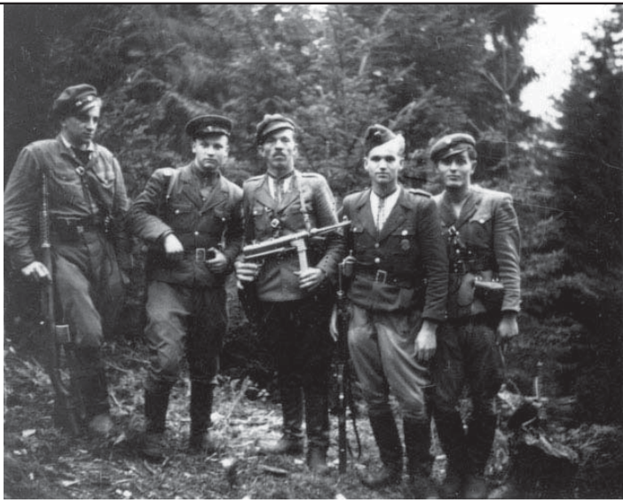
4. Група повстанців. Фото "Липкевича". Світлина №111 з Яворівського архіву УПА.