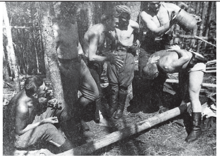
5. Повстанська "лазня". Фото "Липкевича". Світлина №119 з Яворівського архіву УПА.

успішного висліді бою була старанно проведена розвідка, яку здійснила група "Липкевича".