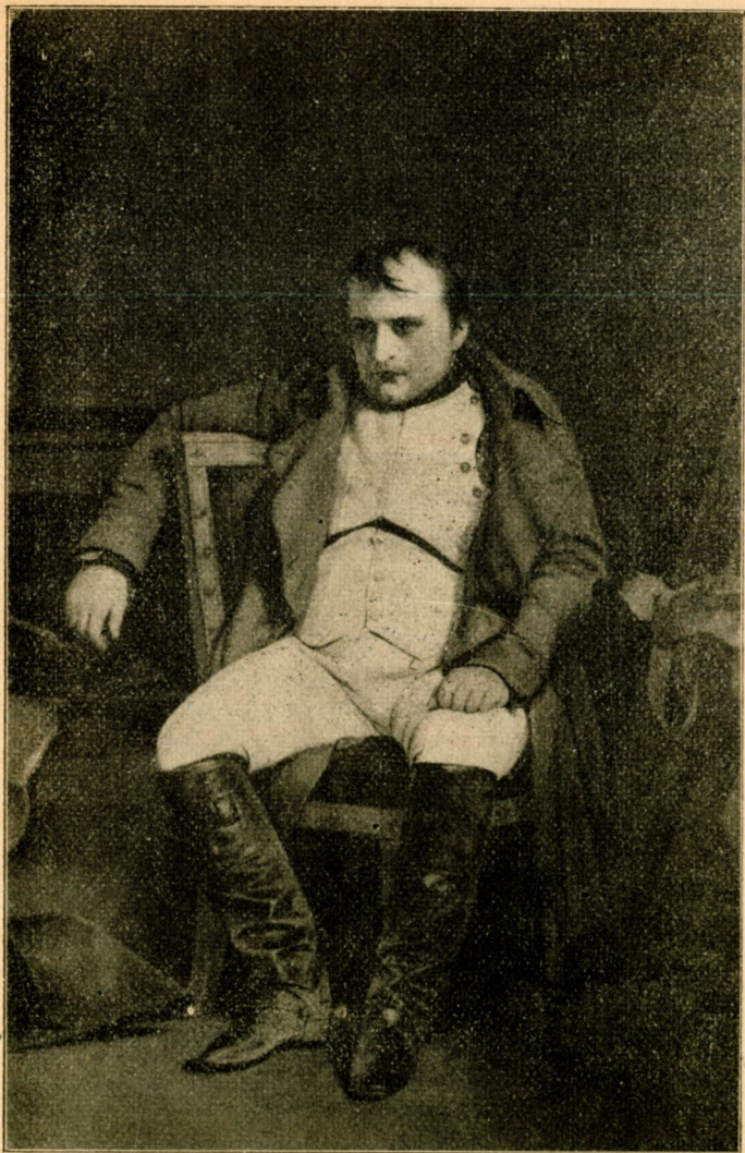
Наполеон I. цїсар Франції від р. 1804—1815.