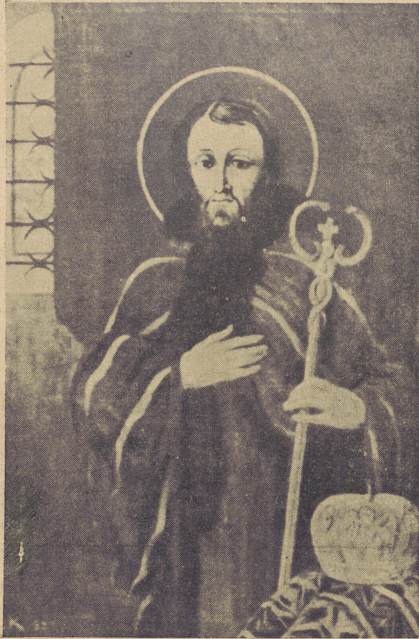
Образ св. свщмч. Йосафата, кисти артистки-малярки проф. Олени Кульчицької, посвячений дня 25. XI. 1937. і поміщений в гімна- зійній каплиці.

цертів з минулих років тим, що програма не була перевантажена надміром точок і те саме вийшло на користь загального вражіння з концерту.