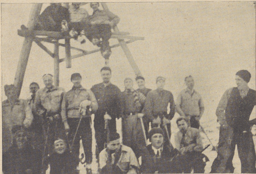
Відпочинок у часі лещетарської прогулки на Тисовій у Либохорі.

Вислід фіналів мистців двійок у відбиванці подав у звітській статейці-нотатці цей сам часопис у 12. ч. з 28. березня 1938. р. у звичайній рубриці. Нотатка теж чисто ділова, а шкода, бо при нагоді фіналів мистецтв можна було зясувати стан українського гімназійного спорту в Перемишлі, подати завваги й висновки та насвітлити теж деякі його недостачі. Такі поглядіві статейки мають нераз велике інструктивно-виховне значення та викликають у молоді належне зрозуміння й бажання працювати над собою, щоб здобути гарні осяги. Дивно теж, що перемиський звітвик, підписаний криптонімом, не зазначив, яку це нагороду уфундувала „Сянова Чайка” перемиським першунам. Статейку наводжу в цілості: