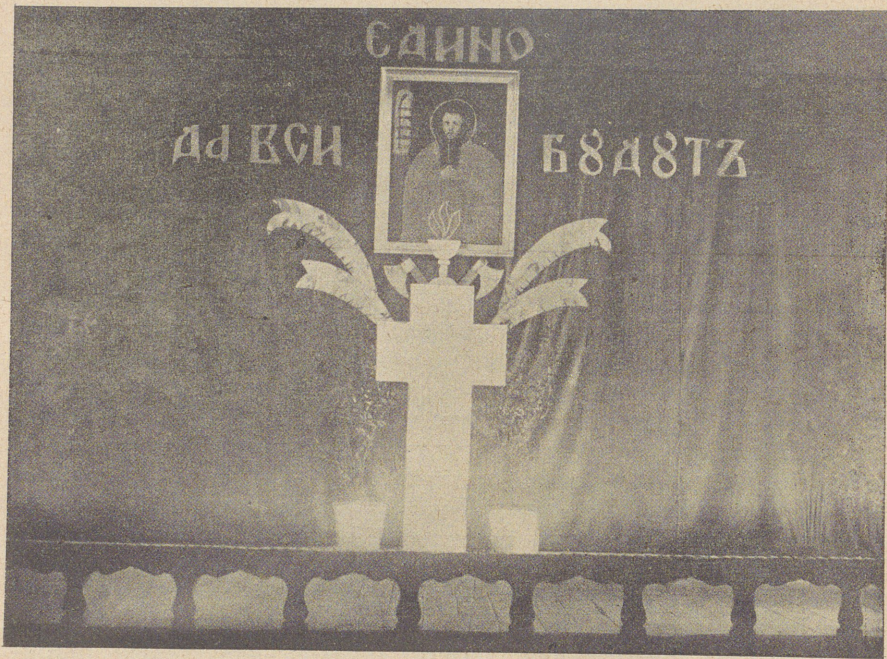
Декорація сцени на святі Патрона Заведення св. Йосафата дня 25. XI. 1938.

Патрона школи, це концерт для вшанування пам'яті св. свщмч. Йосафата, що його влаштовують тепер щороку в день св. Йосафата, цебто 25. листопада. Тоді шкільна молодь вільна від шкільної науки і вранці бере участь у врочистій Службі Божій у гімназійній авлі, після чого відбувається концерт-поранок для самої молоді. Увечорі в 18. год. учні повторюють цей концерт перед публікою, яку складають батьки учнів, учениці перемиської жіночої гімназії „Українського Інституту для дівчат“ і запрошені місцеві громадяни.