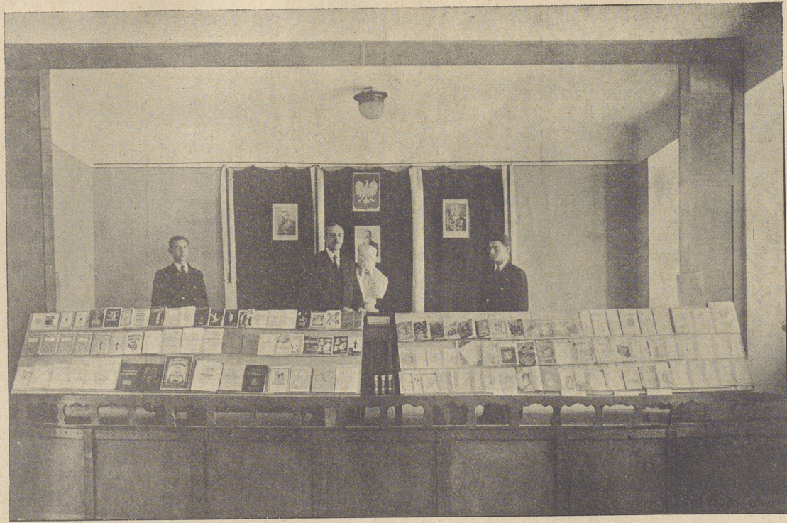
»Тиждень книжки«, влаштований «Читальнею Учнів» дня 22. XI. 1937.

1. „ Нова Зоря ” — Найосновніша та найглибша оцінка по- явилась у відомому часописі „ Нова Зоря ” в ч. 71 (1071) з дня 19. вересня 1937 в рубриці „ Нові видання ”. Представляється вона так: