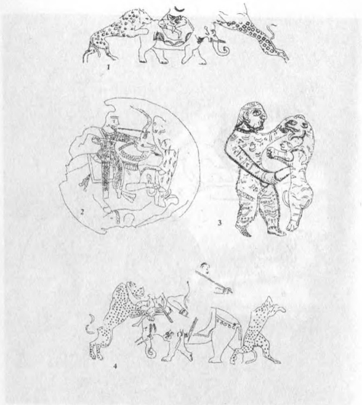
Рис.3: Охотничьи сцены в искусстве Ирана и Центральной Азии. 1 – Фрагмент темперной росписи на южной стене Красного Зала из Варахши. 2- Серебряное блюдо из Кутаиси. Собрание Эрмитажа. 3 – Фрагмент изображения на медальоне серебряной бутылки в форме человеческого лица. Собрание Эрмитажа. 4 – Фрагмент темперной росписи на западной стене Красного Зала из Варахши.