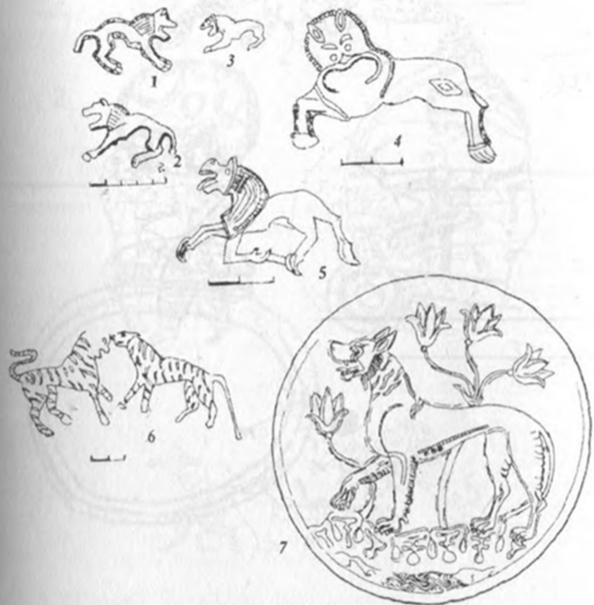
Рис.2: Хищные животные в прикладном искусстве Европы, Кавказа и Центральной Азии. 1; 2 – Факазрет; 3 – Предградненская; 4 – Скибинцы; 5 – Мартыновка; 6 – Кудырге; 7 – ВС91.