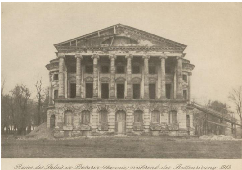
Руїни палацу в Батурині («Батурин») під час реставрації 1912

було п'ятитомне видання Олександра Васильчикова «Сімейство Розумовських» [7, с. 7]. Варто відзначити, що Каміл надавав інформацію та матеріали автору під час написання цієї праці. «Дорогий кузене, як я можу віддячити тобі за твою доброту та довіру, яку ти виявив до мене? ... Я прочитав ваші папери і зробив з них необхідні нотатки. Тож я не хочу їх тримати ні на мить довше... Дозвольте мені тримати портрети ще деякий час...»