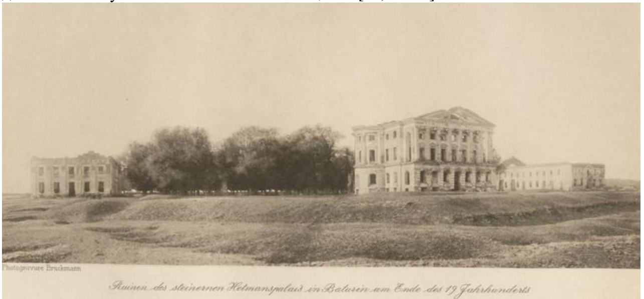
Палацово-парковий ансамбль Кирила Розумовського. Кінець XIX ст.

Будучи австрійським підданим він не забував своє українське коріння і став одним із перших, хто виявив зацікавленість до минулого своїх славних пращурів, вивчав та збирав матеріали про історію свого роду [8, с. 7]. Аналізуючи його листування з Олександром Васильчиковим, правнуком Кирила Розумовського по лінії доньки Ганни, істориком, директором імператорського ермітажу, можемо припустити, що активно досліджувати свою родину Каміл Розумовський почав на початку 80-х років XIX ст. Зокрема на це вказує лист від 24 вересня 1880 р. Олександра Васильчикова до Каміла: «Я щойно отримав Вашого люб'язного листа з цікавими повідомленнями, які ви до нього додали. Я дуже вдячний за те, що ви дали мені можливість познайомитися з двоюрідним братом. ... Я вражений, що ви так добре знаєте, хто ваші родичі в росії. Я надішлю вам докладний список родини, виправивши деякі помилки у вашій генеалогічній таблиці ...» [16, с. 225].