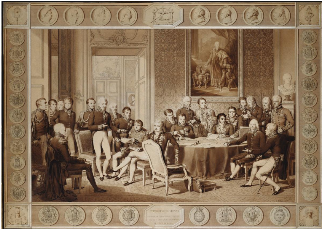
Віденський конгрес. Художник Жан-Батист Ізабе. 1815 р. Королівська колекція

Головною різницею між ескізом та завершеним малюнком є зображення на останньому британського посланця, герцога Веллінгтона, який пізно прибув до Конгресу, щоб змінити Каслрі. Він відтворений у профіль крайнім ліворуч.