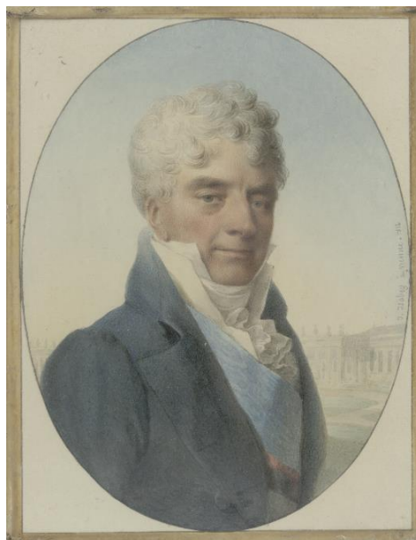
Андрій Розумовський. Художник Жан-Батист Ізабе. 1812 р. АЛЬБЕРТІНА

У нашій публікації ми розкриємо досягнення Андрія Розумовського на європейському саміті, які відображені в унікальних артефактах, віднайдених упродовж 2022 р. істориками Національного заповідника «Гетьманська столиця» у європейських культурно-освітніх та наукових закладах: Австрійському державному архіві, АЛЬБЕРТІНІ, Британському музеї, Британській Королівській Колекції, Віденській бібліотеці в Ратуші, Луврі, Національному трасті місць історичної значущості та природної краси Великої Британії. Особливою гордістю є те, що значна частина експонатів містить зображення герба гетьманської родини, тож більш-детально висвітлимо їх історію.