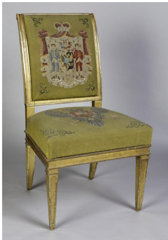
Стілець для Андрія Розумовського, створений з нагоди Віденського конгресу. Виробник Грегор Нутцінгер, оббивчик Майкл Ремеле. 1814 р. Національний Траст

Стільці виготовили у Відні у 1814 – 1815 рр. в майстерні імператорського виробника стільців Грегора Нутцінгера. Їх каркаси зроблені з буку, оздоблені гіпсом і покриті сусальним золотом. Позолота на рельєфних елементах відполірована, а в інших місцях залишена матовою.