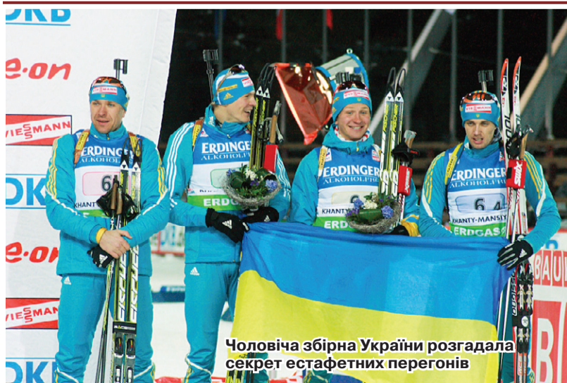
Чоловіча збірна України розгадала секрет естафетних перегонів

» ДВІ «БРОНЗИ» Й ДОДНЕ «СРІБЛО» ЧЕМПІОНАТУ СВІТУ - З ТАКИМ ПРИСТОЙНИМ (СЬОМЕ МІСЦЕ ЗА СУКУПНОЮ ТАБЛИЦЕЮ МЕДАЛЕЙ) ЗДОБУТКОМ ЗАЛИШИЛИ ПОЛЯРНИЙ ХАНТИ-МАНСІЙСЬК УКРАЇНСЬКІ БІАТЛОНІСТИ. ЗОКРЕМА, ЧОЛОВІЧА ЕСТАФЕТА ВПЕРШЕ ЗА ВСІ СУВЕРЕННІ РОКИ ОСІДЛАЛА ПОДІУМ, СТАВШИ ТРЕТЬОЮ СЛІДОМ ЗА ОБ'ЄКТИВНО КРУТІШИМИ, ПРИНАЙМНІ ФІНАНСОВО, НОРВЕГІЄЮ ТА РОСІЄЮ.