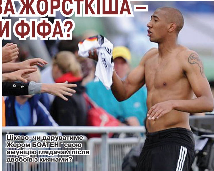
Цікаво, чи даруватиме Жером БОАТЕНГ свою амуніцію глядачам після двобоїв з киянами?

» ЗАПИТАННЯ АЖ НІЯК НЕ РИТОРИЧНЕ. ЗНАНИЙ АНГЛІЙСЬКИЙ КЛУБ НАСТУПНОГО ТИЖНЯ ЗАВІТАЄ ДО КИЄВА, АБИ ЗІГРАТИ З ДИНАМІВЦЯМИ В 1/8 ФІНАЛУ ЛІГИ ЄВРОПИ. ПІДОПІЧНІ РОБЕРТО МАНЧІНІ ВТІШИЛИСЯ ВІІЗНИМИ 0:0 З ГРЕЦЬКИМ «АРИСОМ», АБИ ЗГОДОМ У РІДНИХ СТИНАХ «РОЗКАТАТИ» СУПЕРНИКА НА