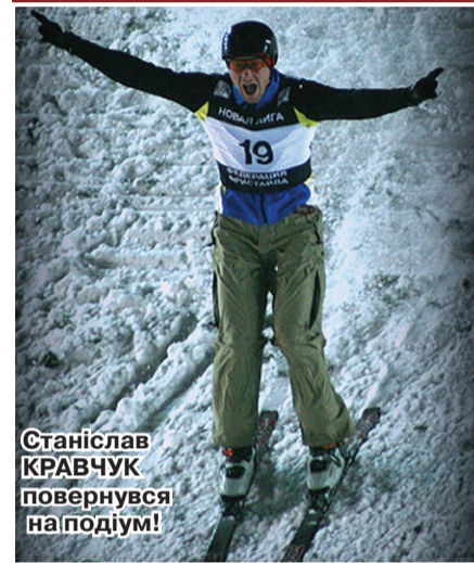
Станіслав КРАВЧУК повернувся на подіум!

» ТРЕТЄ МІСЦЕ ЗАКАРПАТЦЯ НА ЧЕРГОВОМУ ЕТАПІ КУБКА СВІТУ З ФРІСТАЙЛУ В КАНАДСЬКОМУ МОН-ГАБРІЕЛІ ВАРТО ВВАЖАТИ ПЕРЕМОГОЮ, НАСАМПЕРЕД, ВОЛІ НАД ОБСТАВИНАМИ. АДЖЕ ПІСЛЯ ТРАВМИ ХРЕСТОПОДІБНОЇ ЗВ'ЯЗКИ, ЯКОЇ СТАНІСЛАВ КРАВЧУК ЗАЗНАВ НЕЗАДОВГО ДО ТОРИШНЬОЇ ЗИМОВОЇ ОЛІМПІАДИ, ІШЛОСЯ ПРО ДОСТРОКОВЕ ЗАВЕРШЕННЯ КАР'ЄРИ.