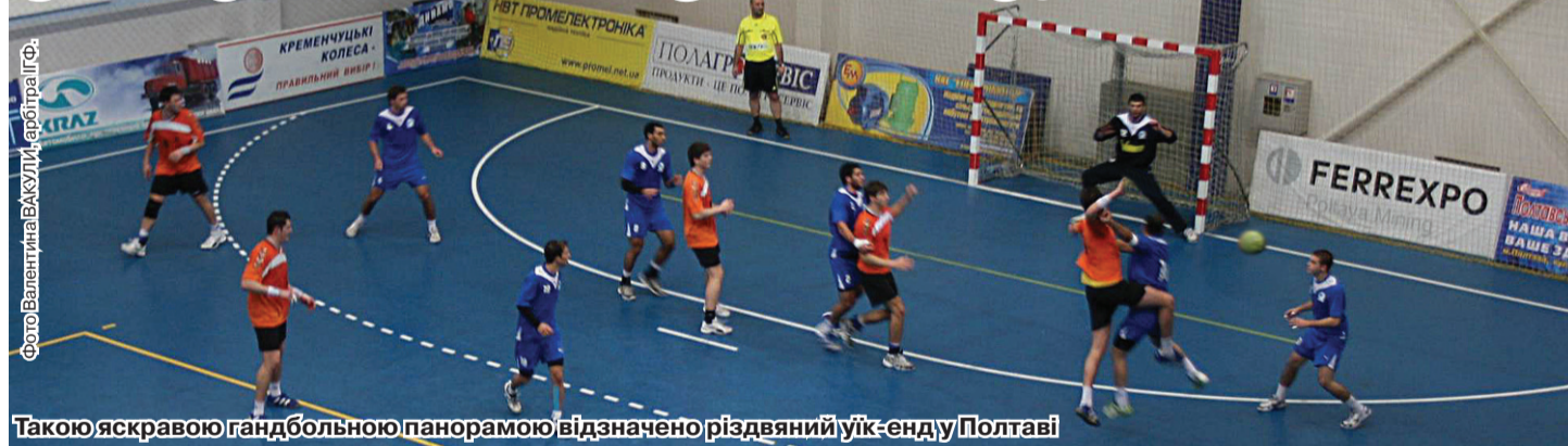
Такою яскравою гандбольною панорамною відзначено різдвяний уїк-енд у Полтаві

ТАКИЙ ЗАГОЛОВОК АЖ НІЯК НЕ Є ПЕРЕБІЛЬШЕННЯМ. МОЛОДІЖНИХ ЧЕМПІОНАТІВ СВІТУ МИ НЕ ПРИЙМАЛИ В ЖОДНОМУ З ЛІТНІХ ІГРОВИХ ВИДІВ СПОРТУ. АЖ ОСЬ У КОМФОРТНОМУ СПОРТКОМПЛЕКСІ «ДИНАМО» ЗІБРАЛИСЯ ЗБІРНІ 20-РІЧНИХ ГАНДБОЛІСТІВ НІМЕЧЧИНИ, УКРАЇНИ, ШВЕЙЦАРІ ТА ІЗРАЇЛЮ. ЧОМУ САМЕ В ЦІЙ ПОСЛІДОВНОСТІ ФІНІШУВАЛИ ВОНИ В СУПЕРЕЧЦІ ЗА ЄДИНУ ФІНАЛЬНУ ПУТІВКУ – ПРО ЦЕ НИЖЧЕ. А ТУТ ВАЖЛИВИЙ САМИЙ ФАКТ – ДЕ І ЯК.