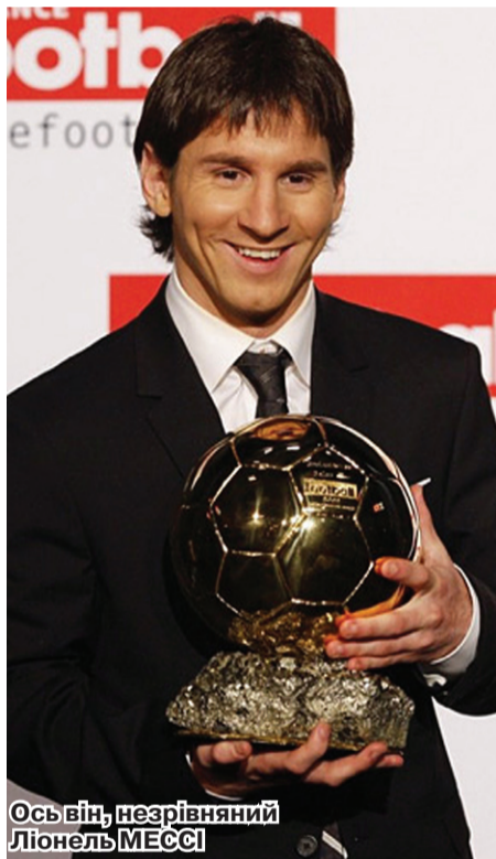
Ось він, незрівняний Ліонель МЕССІ

За підсумками голосування, триумфатором вдруге поспіль став аргентинський форвард каталонської «Барселони» Ліонель Мессі. Він отримав 22,65 відсотка голосів, випередивши своїх одноклубників (і чемпіонів світу в Африці) – півзахисників Андреса Іньесту (17,36) та Хаві Ернандеса (16,48). Звісно, вони увійшли