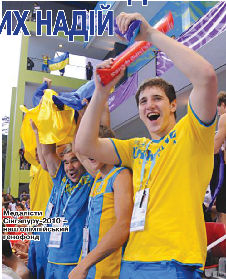
Медалісти Сінгапуру-2010 – наш олімпійський генофонд

» ЩО ЗДАТНЕ ЗІБРАТИ НА ОДНІЙ СЦЕНІ ПРЕЗИДЕНТА МОК ЖАКА РОГГЕ, КЕРМАНІЧА ЄВРОПЕЙСЬКИХ ОЛІМПІЙСЬКИХ КОМІТЕТІВ ПАТРИКА ДЖОЗЕФА ХІККІ, ДИТЯЧУ СТУДІЮ АНСАМБЛЮ ІМЕНІ ПАВЛА ВІРСЬКОГО, БАНДУРИСТА ВАЛЕНТИНА ЛИСЕНКА Й ВІТЧИЗНЯНИХ ГЕРОІВ СПОРТУ? НЕ ВІДГАДУЙТЕ – ЦЕ СВЯТКУВАННЯ 20-РІЧЧЯ НОК УКРАЇНИ, ЯКИЙ НАРОДИВСЯ ЩЕ ЗА ІСНУВАННЯ СРСР І СТАВ ПРОВІСНИКОМ НАШОЇ НЕЗАЛЕЖНОСТІ.