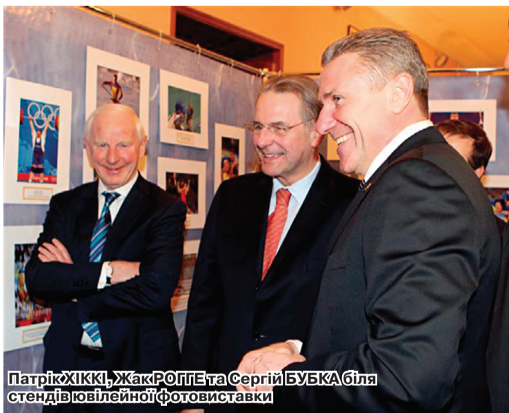
Патрік ХІККІ, Жак РОГГЕ та Сергій БУБКА біля стендів ювілейної фотовиставки

вони спілкувалися з Леонідом Кравчуком. І той сказав, що вітчизняні атлети й тренери сприяють іміджу держави значно більше, ніж усі посли, разом узяті, яким президент видає зарплату. Знаний бельгійець висловив упевненість, що шестисоту медаль Україна (яка з 1952 року завоювала 299 золотих, 167 срібних та 133 бронзові відзнаки), виграє на початку Олімпіади-2012 у Лондоні. Що ж, таку надію ми плекаємо.