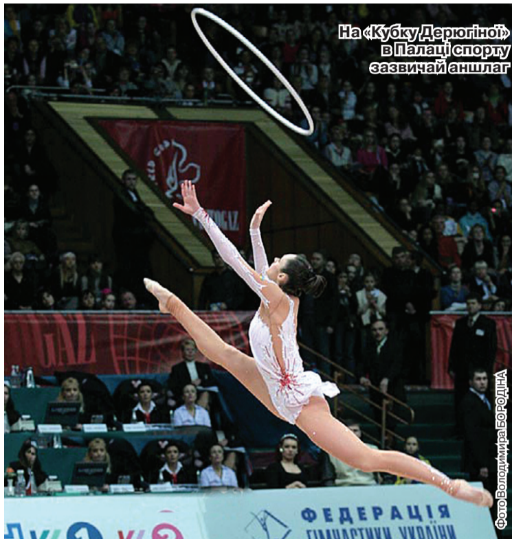
На «Кубку Дерюгіної» в Палаці спорту зазвичай аншлаг

Щоправда, в межах цієї вочини Дмитра Табачника буде створена Державна служба молоді та спорту України. Як в неї будуть права й матеріальні ресурси – ще належить дізнатися. Хай там як, а вітчизняний спорт втрачає провідний урядовий статус, а Равіль Сафіуллін уже не є міністром спорту. Наскільки вагомої уваги чекати відтепер «спортсменам», коли до цього