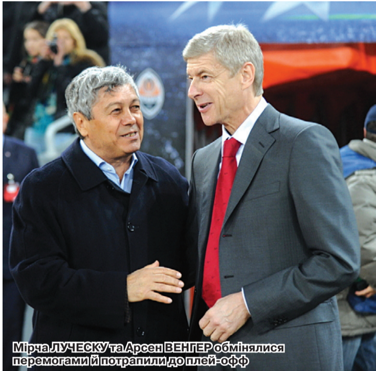
Мірча ЛУЧЕСКУ та Арсен ВЕНГЕР обмінялися перемогами й потрапили до плей-оф

Аспект третій – робота «на рейтинг». Поразка лондонців від «Браги» (0:2 три тижні тому) знищила привід вважати цю групу «фестива-