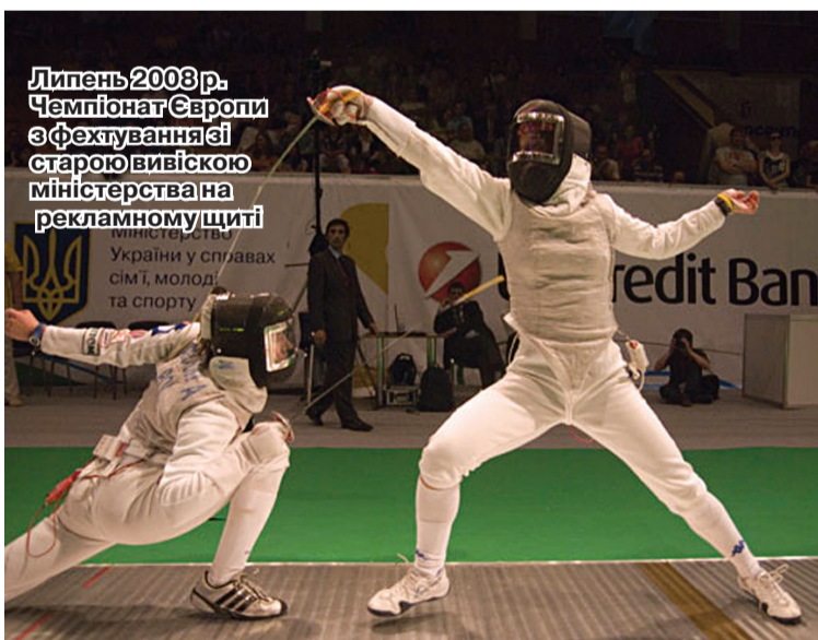
Липень 2008 р. Чемпіонат Європи з фехтування в старій вивісці міністерства на рекламному щиті

Нам було замало в лютому 2004-го міністерства у справах сім'ї, дітей та молоді, так за 12 місяців отримали напис «...у справах молоді та спорту». Згодом до них причепили «сім'ю». Тепер – дишайте глибше – матимемо Міністерство освіти і науки, молоді та спорту України.