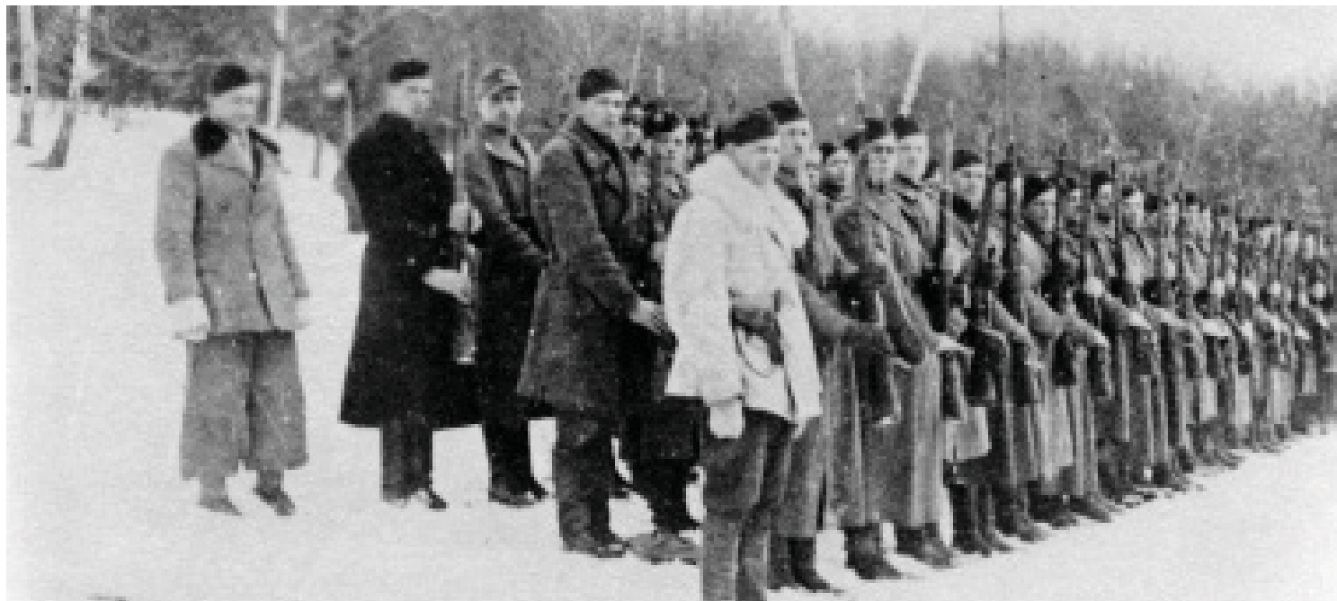
Фото 1. Невідома сотня Третьої ВО «Лисоня» готова до звіту (після команди «Почесть крісом дай!»). Зима 1943–1944 рр.