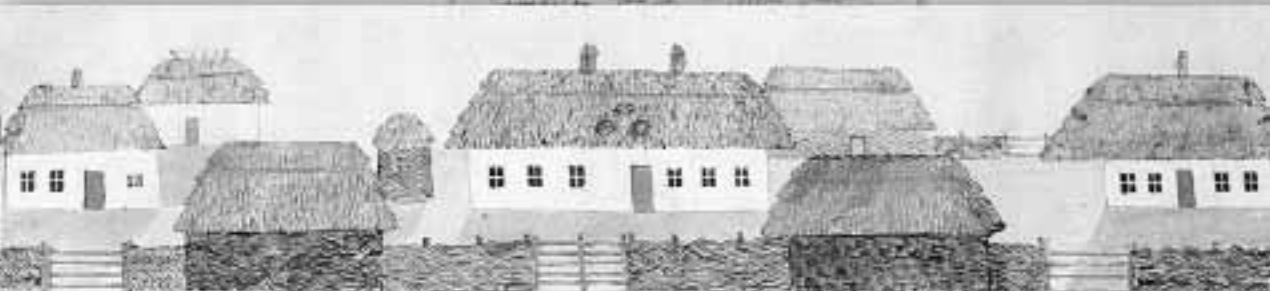
Exemplaire des chaumières des paysans des districts de Kiev et d'autres. Окремаста крестинських жилищъ въ уездахъ Кіевско-мъ, Засулковско-мъ и прех.