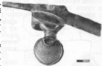
Рис. 2. Деталь бронзових вудил з с. Теремці.

На вудилах з Теремців і аналогічних їм нащічні ремені прив'язувались до стержня псаліїв, що не можна вважати найкращим способом кріплення. За межами Північного Причорномор'я вироби подібного типу поки що невідомі. Є всі підстави вважати, що це локальний тип вудил, що склався в Північному Причорномор'ї і який можна віднести до пізньокімерійського, доскіфського культурного комплексу.