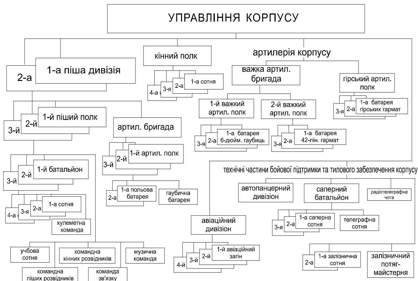
Схема 2. Організаційна структура армійського корпусу (у мирний час).

Організаційна структура корпусу (у мирний час) представлена на схемі 2 (складено дисертантом на підставі аналізу архівних документів) [20, арк.49,51], [17, арк. 4].