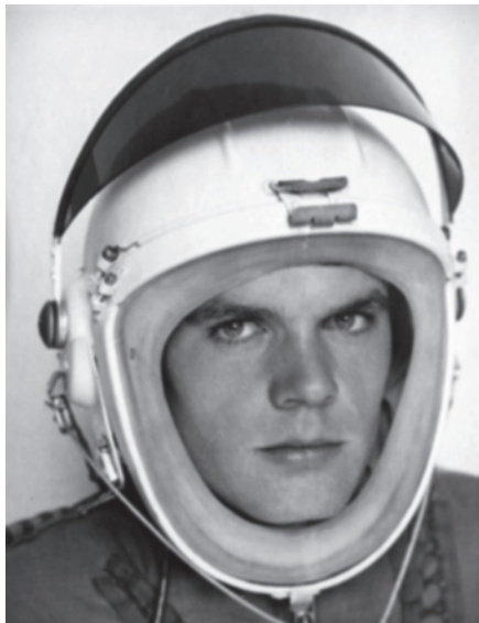
Перед польотом на реактивному винищувачі МіГ-21. Курсант 4-го курсу, 1966 р.