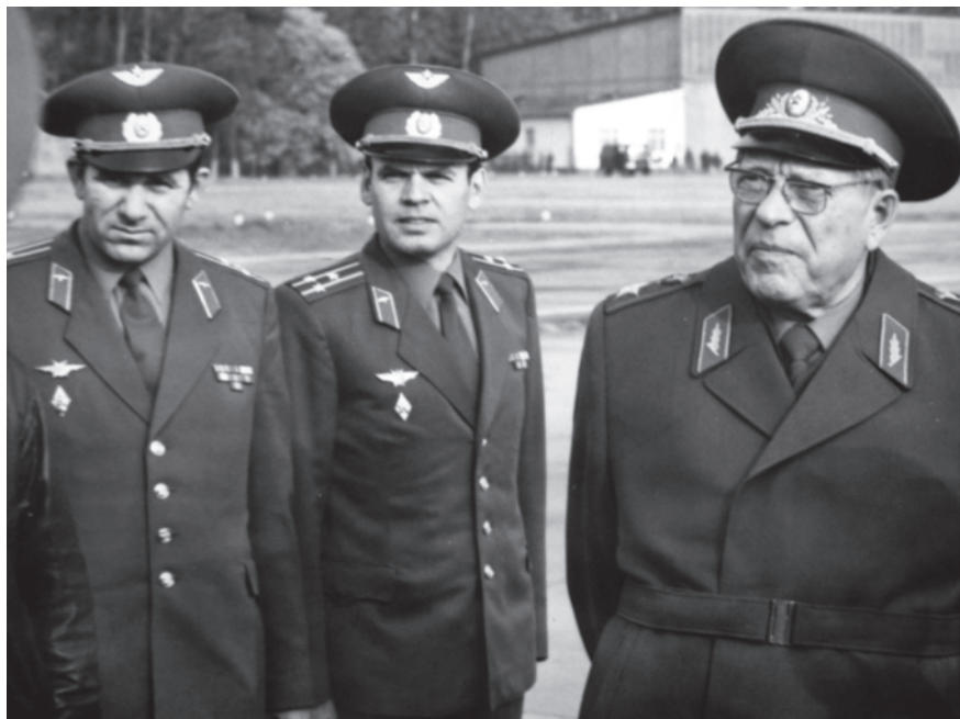
Зустріч в авіаційному гарнізоні з Міністром оборони СРСР Д. Устиновим. Центральна група військ (Чехо-Словацька Соціалістична Республіка), 1981 р.