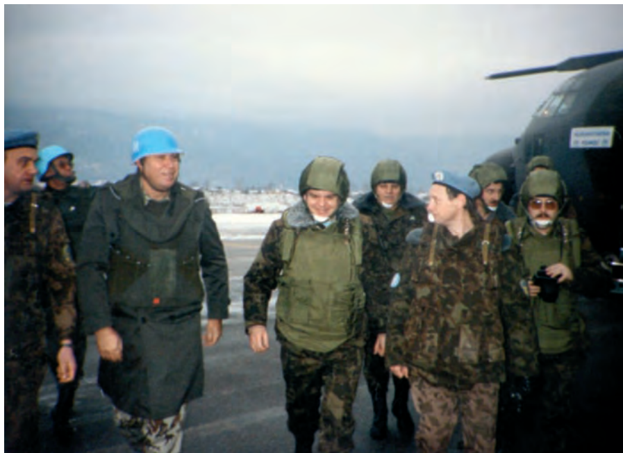
У підрозділі українських миротворців. 1993 р.

Підсумкова перевірка військ за 1992 р. показала, що із військових формувань, дислокованих на території держави, створено Збройні Сили України, які, за оцінкою Президента Л.Кравчука, „... здатні захистити свою державу, свій народ” 43 . Збройні Сили України набули вже досить чіткої структури, але попереду була ще велика робота.