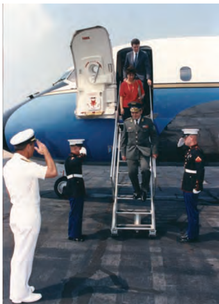
Початок візиту на військово-морську базу Атлантичного командування НАТО Саклант. Норфолк, 1993 р.

Основна увага Міністра оборони та інших керівників Збройних Сил України в той час зосереджувалася на реформуванні органів управління всіх ланок, з'єднань і частин Сухопутних військ, частин Військово-Повітряних Сил, установ і закладів військової освіти, створенні Військово-Морських Сил, а також на розробленні Стратегічного плану застосування Збройних Сил, плануванні й контролі за виконанням заходів бойової готовності у військах (силах) та бойового чергування, плануванні підготовки Збройних Сил, органів управління стратегічної і оперативно-стратегічної ланок, організації та підтриманні взаємодії між органами управління (штабами) видів Збройних Сил, родів військ, з міністерствами і відомствами, іншими державними структурами 44 .