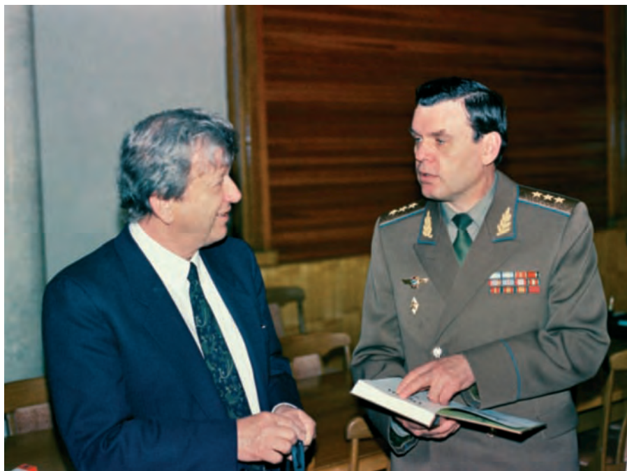
Під час зустрічі з відомим канадським істориком Орестом Субтельним. 1993 р.

З метою забезпечити колегіальність у виробленні рішень Президент України 16 травня 1992 р. видав Указ „Про утворення колегії Міністерства оборони України і військових рад у військових округах (оперативних командуваннях), об’єднаннях Збройних Сил України”. До складу коле-