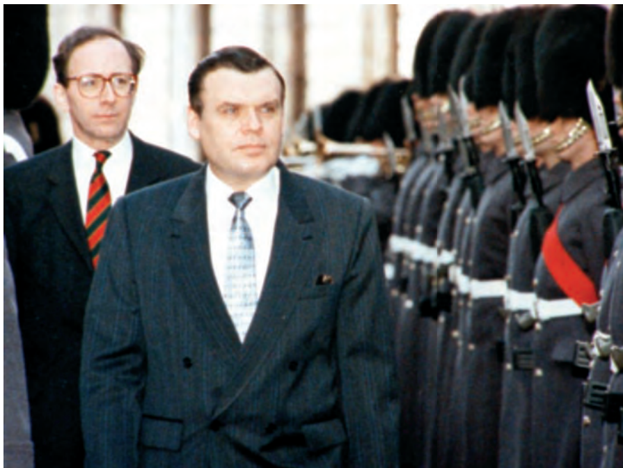
З офіційним візитом у Великій Британії. Грудень 1992 р.

України зі збереженням їхньої бойової готовості. Відповідно до цього варіанту, усі частини, з'єднання та об'єднання, що дислокувалися на українській території, мали діяти під юрисдикцією Верховної Ради УРСР. На сесії Великої ради Руху було обговорено потребу створити Головне командування військового угруповання на території України, депутатську комісію з питань оборони та безпеки, а також військове відомство при Раді Міністрів УРСР. На військове відомство передбачалося покласти завдання щодо формування військових комісаріатів, комплектування територіальних частин і з'єднань на базі дислокованих на теренах республіки угруповань військ Радянської армії і Військово-Морського флоту з перепідпорядкуванням їх Україні, взаємодією з Міністерством оборони СРСР (у тому числі й в оперативно-стратегічних питаннях), опрацювання Военної доктрини України.