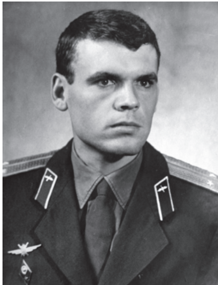
Випускник Харківського ВВАУЛ ім. С.І.Грицевця отримав перше військове звання „лейтенант”. 1967 р.