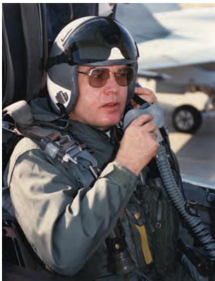
У кабіні американського винишувача. 1993 р.