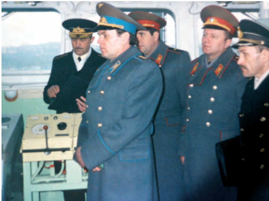
На бойовому кораблі ВМС України. 1993 р.

уточнені й від того часу основні зусилля його працівники спрямували на забезпечення бойової готовості органів управління і військ (сил) у всіх ланках ЗС України.