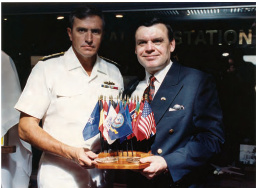
Світлина на згадку про відвідини бази в Норфолку. 1993 р.