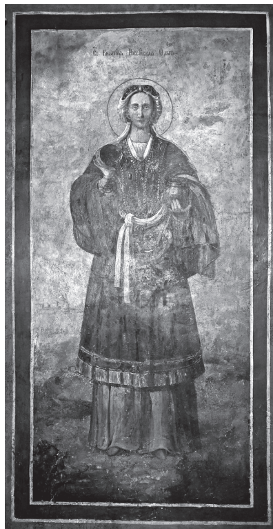
Княгиня Ольга. Олійний живопис початку XVIII ст. Капела Івана Мазени Софії Київської

Станом на 957 р. з часу укладення останнього візантійсько-руського договору пройшло понад десять років. За той час змінились правителі у Візантії і на Русі. У тогочасній політичній “традиції” 2 необхідно було потвердження міждержавного договору. В такому випадку візит руської княгині в столицю імперії виглядає цілком логічним. Як би не була зацікавлена Візантія в торгівлі з Києвом, ініціатива завжди виходила від останнього. Унікальність ситуації полягала в тому, що Ольга, на відміну від своїх попередників, “аргументувала” свої інтереси не силою, а мирним шляхом, зробивши кроки в ідеологічному зближенні – прийнявши християнство. Таким чином можна припустити, що і у випадку з хрещенням Ольги, ініціатива виходила з боку Києва, а не Візантії.