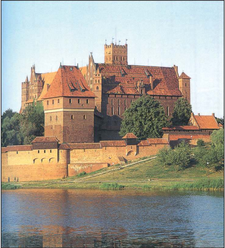
Марієнбург (нині – Мальборк). Загальний вид замкового комплексу. Сучасний стан.