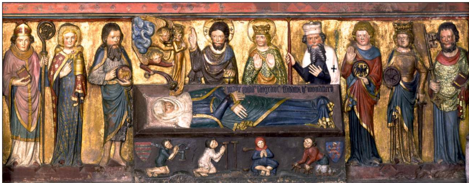
Смерть св. Єлизавети Угорської. Рельєф саркофагу у церкві св. Єлизавети в Марбурзі. Серед скульптур – верхній магістр Німецького ордену Конрад Тюринзький (Марбург, бл. 1370 р.).