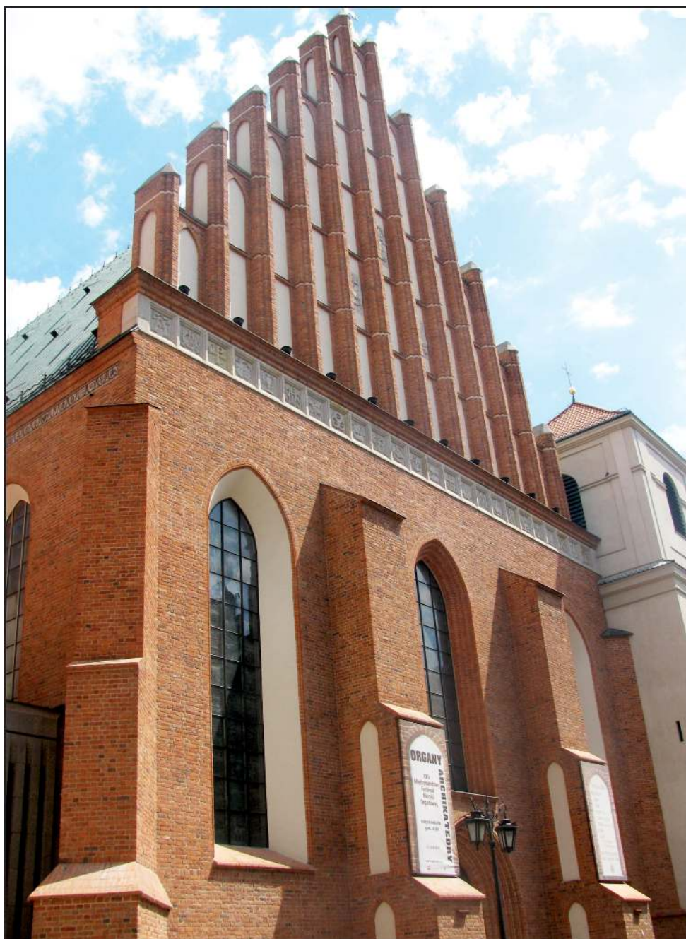
Архікафедральна базиліка св. Іоанна Хрестителя у Варшаві, де 15 вересня 1339 р. було зачитано судовий вирок у справі другого польсько-орденського канонічного процесу.