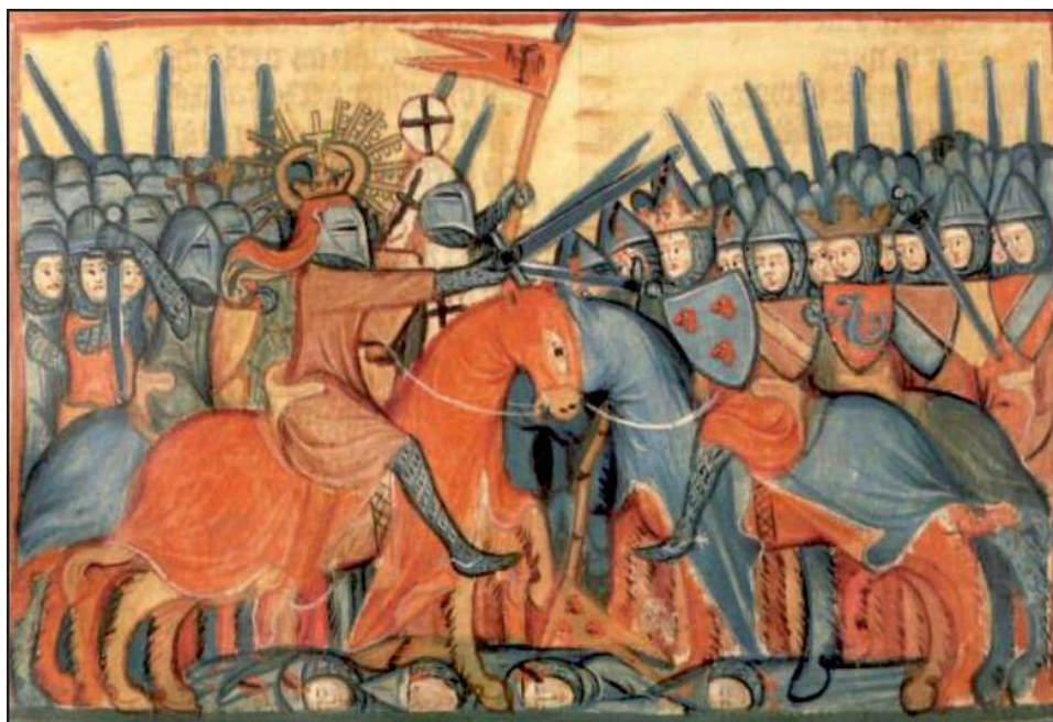
Битва імператора Священної Римської імперії з народами Гог і Магог. Поруч з імператором зображено магістра Німецького ордену, який тримає імперський стяг. (Апокаліпсе Heinrichs von Hesler, Пруссія, друга третина XIV ст.)