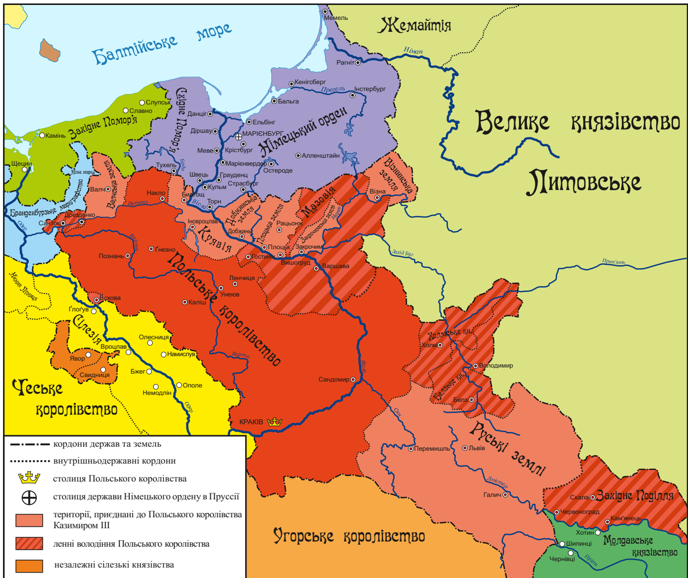
Польське королівство і Німецький орден за часів Казимира III (1333–1370).