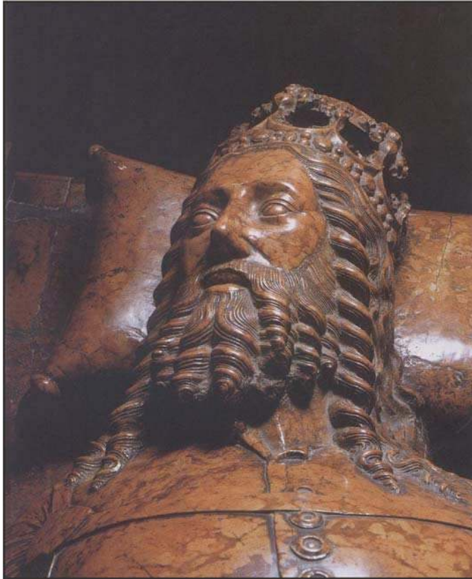
Фрагмент надгробка короля Казимира III в архікафедральній базиліці свв. Станіслава та Вацлава у Вавельському замку (Краків, 1370–1382 рр.).