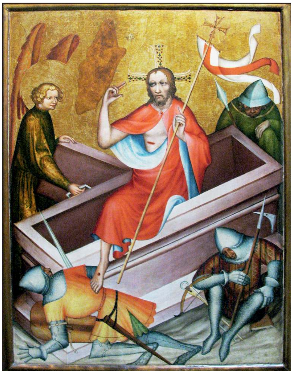
Воскресіння Христа. Фрагмент поліптиха з Грауденца (нині – Грудзьондз). Бл. 1400 р.