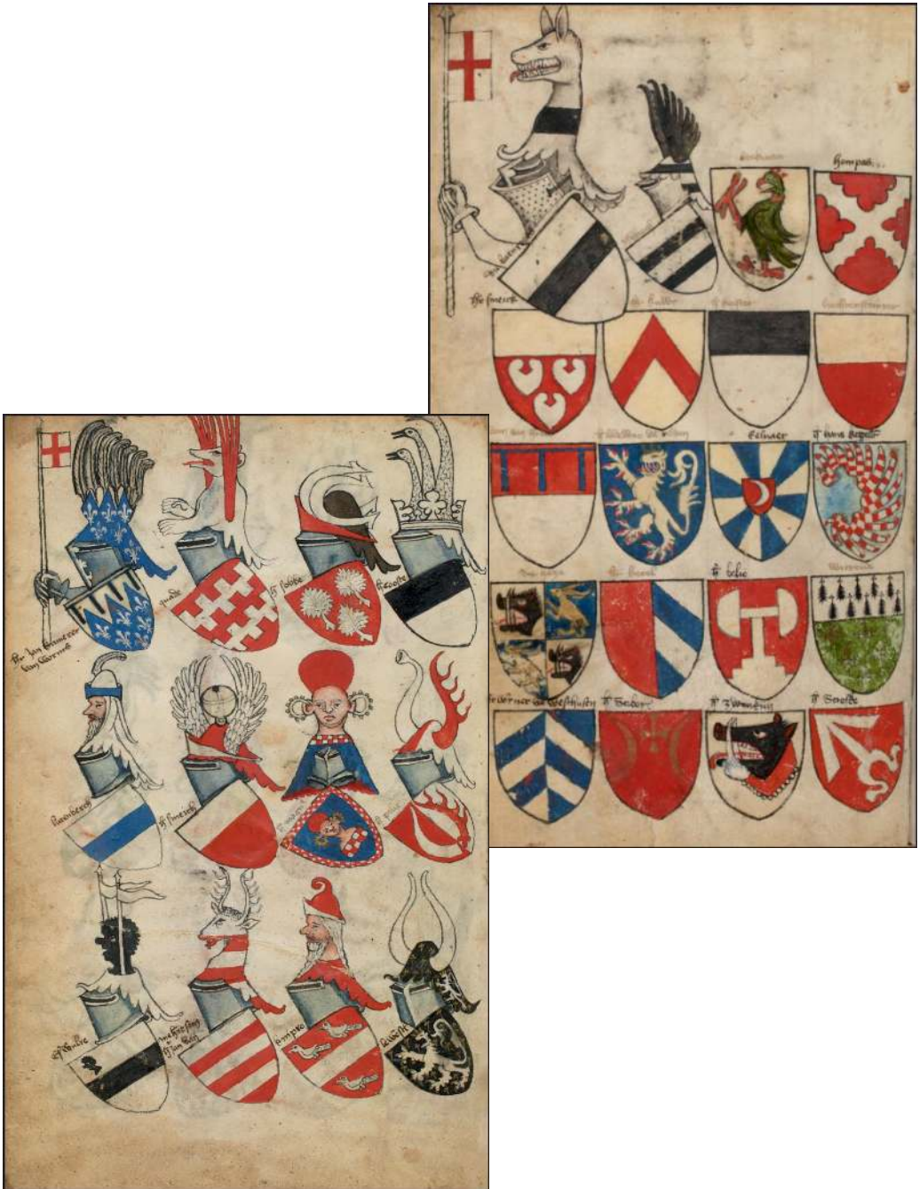
Гербові ролі із зображенням гербів польських рицарів – учасників пруських «райзів» (Armorial Bellenville, Нідерланди, друга пол. XIV ст.).