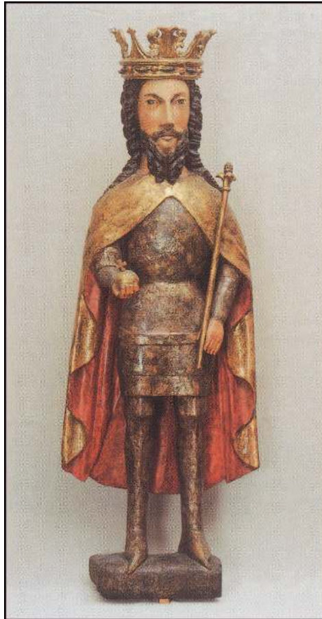
Поліхромна скульптура із зображенням короля Казимира III з колегіальної базиліки Народження Пресвятої Діви Марії у Віслиці (Краків, бл. 1380 р.).