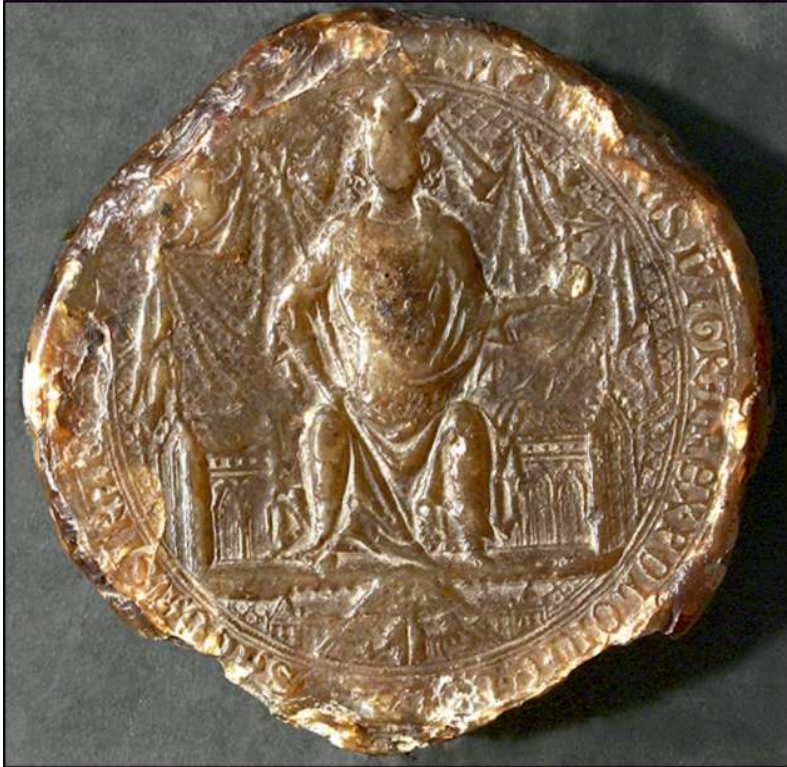
Маєстатна печатка короля Казимира III (бл. 1370 р.).