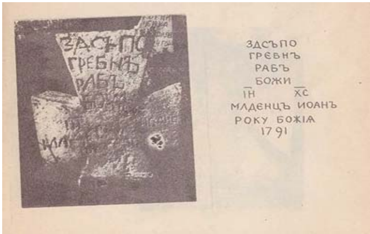
Ілюстрація 1. Фрагмент з книги Р. Шувалова: Шувалов Р. Про що розповів некрополь (Куяльницьке козацьке кладовище міста Одеси). – Київ, 1992. – С. 30.