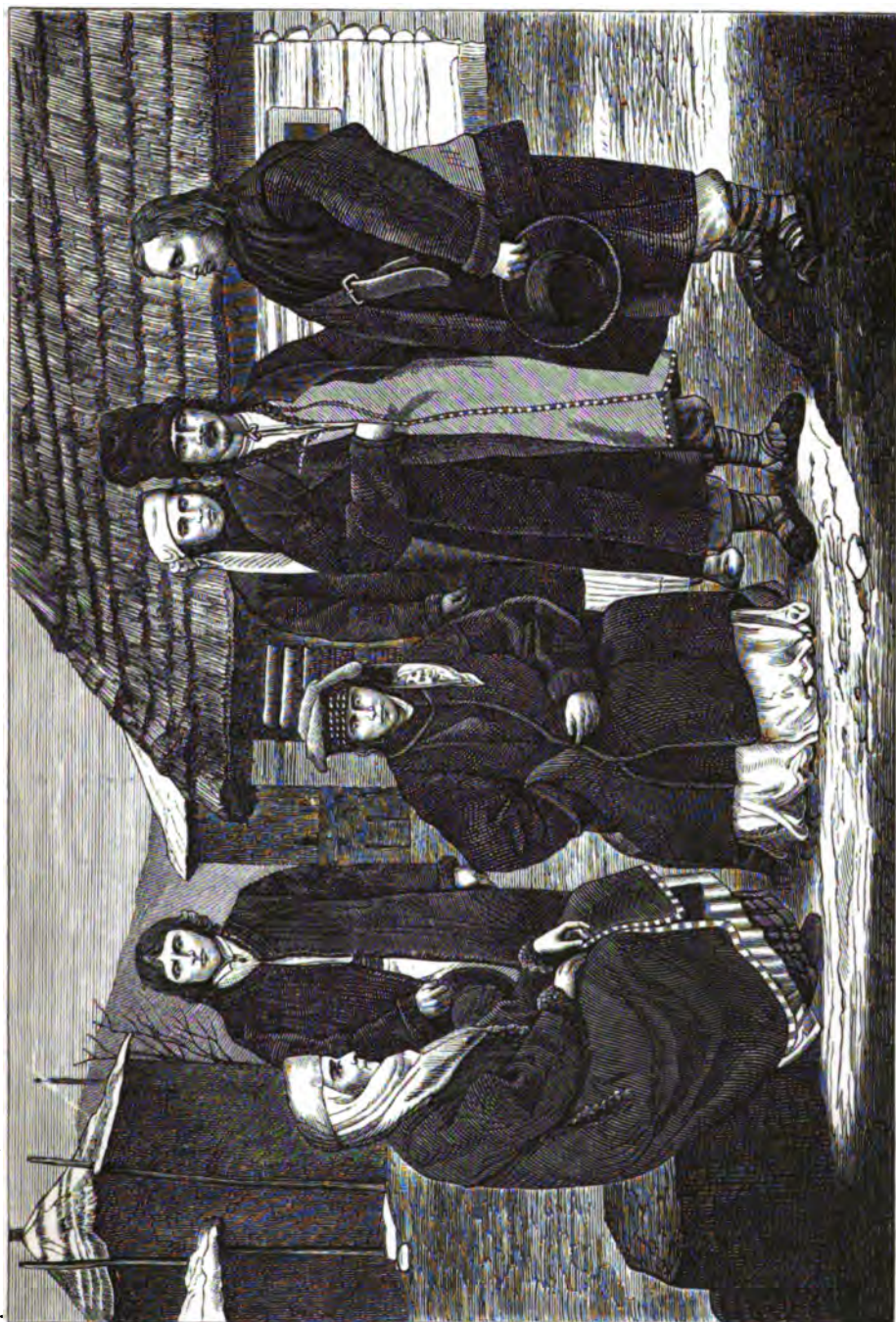
Русскіе горцы (Бойги) Стрыйскаго уѣзда села Вышняго Синеводса въ восточной Галичинѣ.