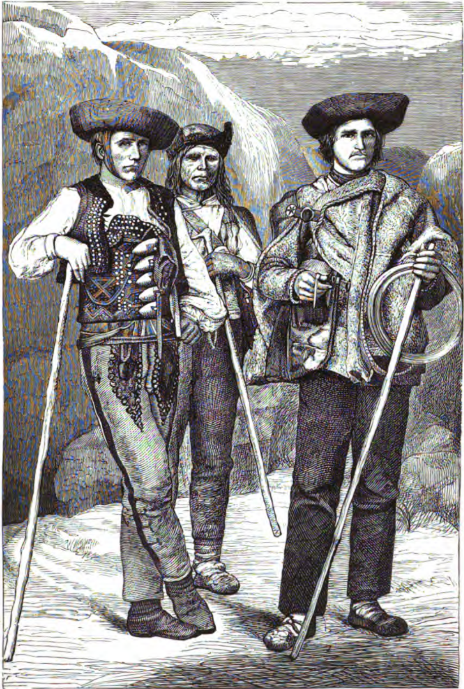
Русскіе горцы Спишской столицы, 1) югась (пастухъ) Подградскаго уѣзда села Топковецъ и 2) два дротаря Магурскаго уѣзда села Литманова въ Угорщинѣ.