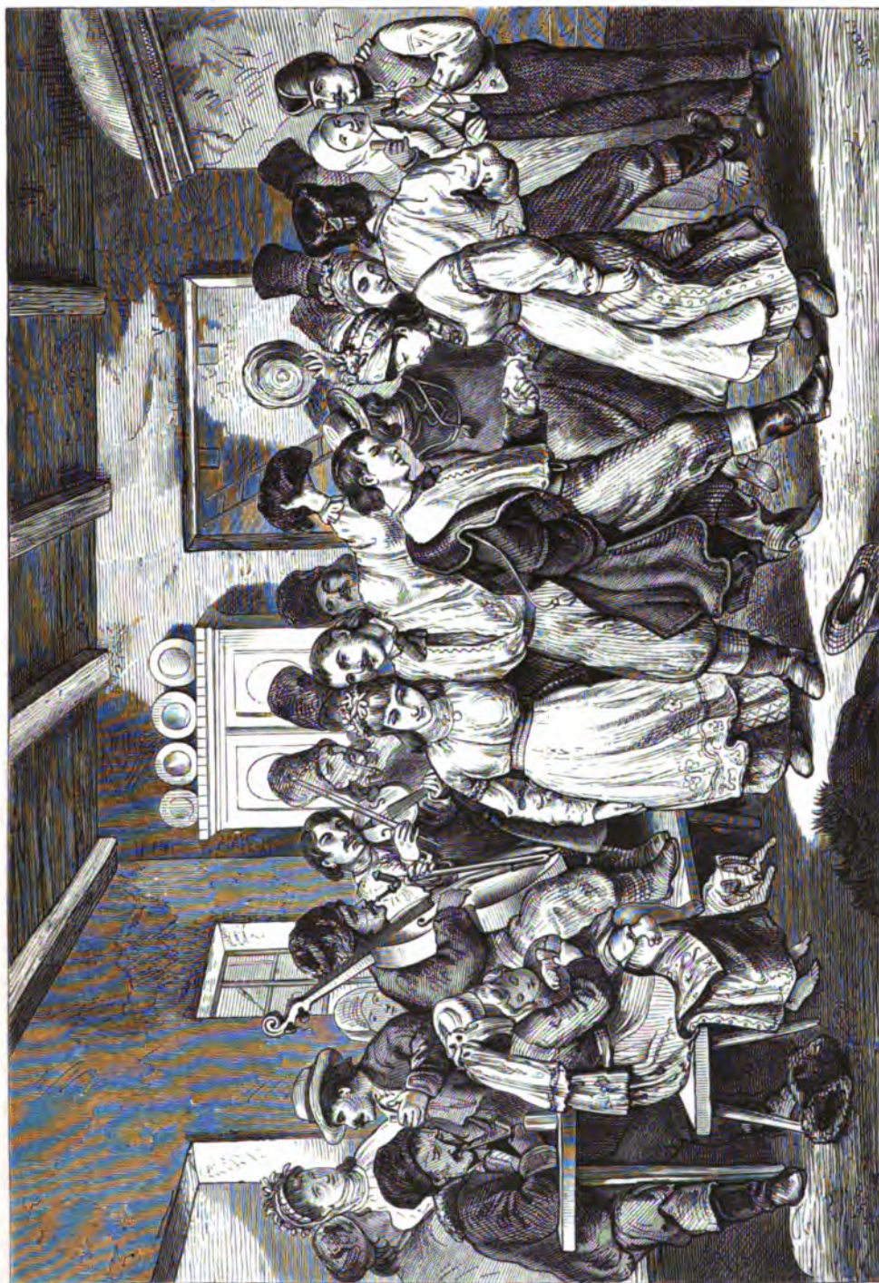
Пляска русских крестьянъ въ корчмѣ воездъ м. Копаичица Чортковскаго уѣзда восточной Галичины.