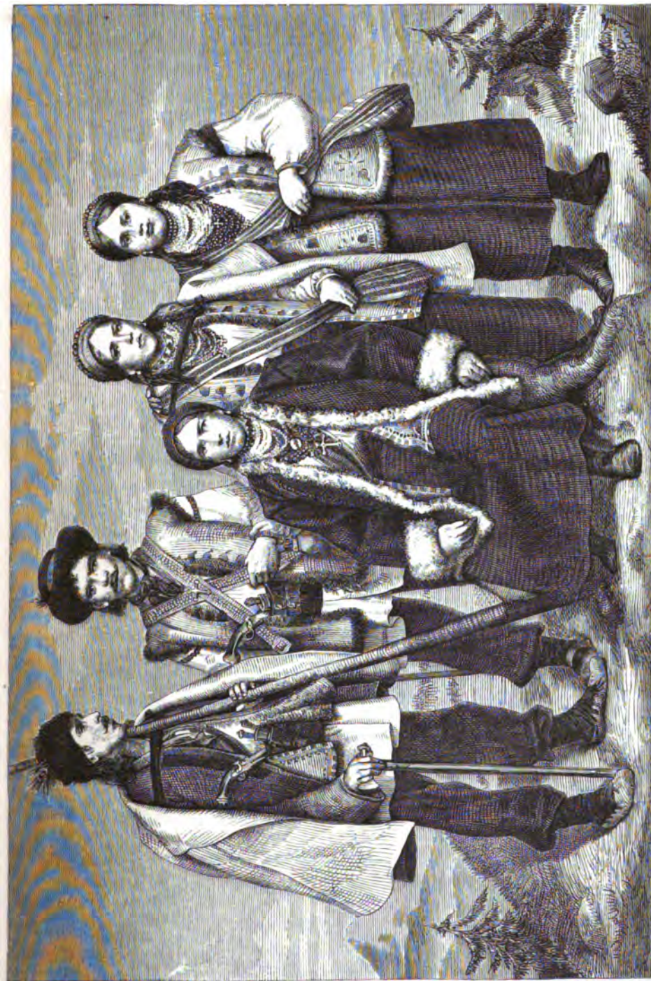
Русские горцы (Хуцулы) Коломыйского уезда села Доры въ восточной Галичинѣ.