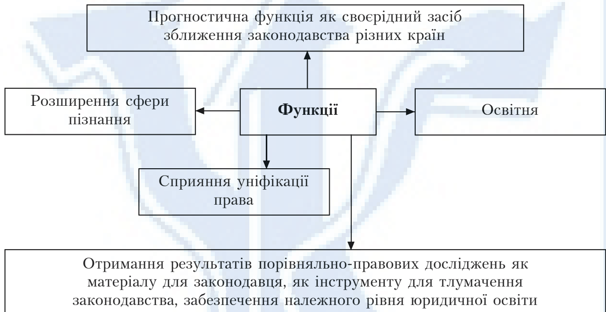
Рис. 2. Функції порівняльного правознавства

ною дисципліною. Одна з основних функцій порівняльного правознавства — це розширення сфери пізнання. Якщо під правовою наукою розуміти не лише тлумачення національних законів, правових принципів і норм, а й дослідження моделей для запобігання і регулювання соціальних конфліктів, то очевидно, що компаративістика має ширший спектр типових рішень, ніж національно замкнута правова наука 1 .