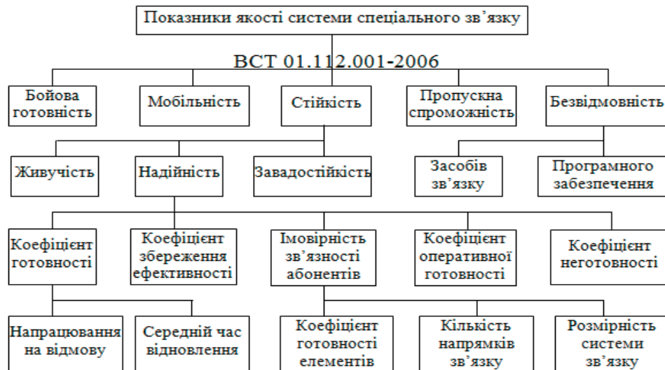
Рис. 2. Показники якості системи спеціального зв'язку

Відомі ознаки, які дозволяють визначити систему як складну: велика кількість взаємопов'язаних елементів, відсутність формальної математичної моделі функціонування, теоретико-імовірнісний спосіб опису з використанням різноманітного математичного апарату. За думкою Поварова Г. І. складна система повинна складатися із тисяч елементів, а Берг А. І. вважав, що її опис вимагає не менше двох математичних мов [4].