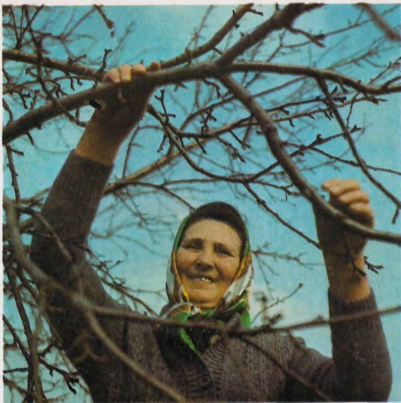
Уже й весна прийшла!