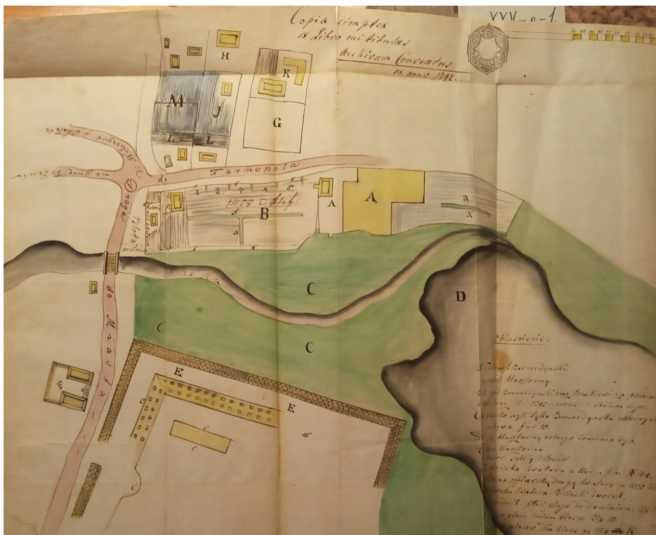
Рис. 1. Рукописна карта монастиря оо. Бернардинів у Збаражі XVIII ст.