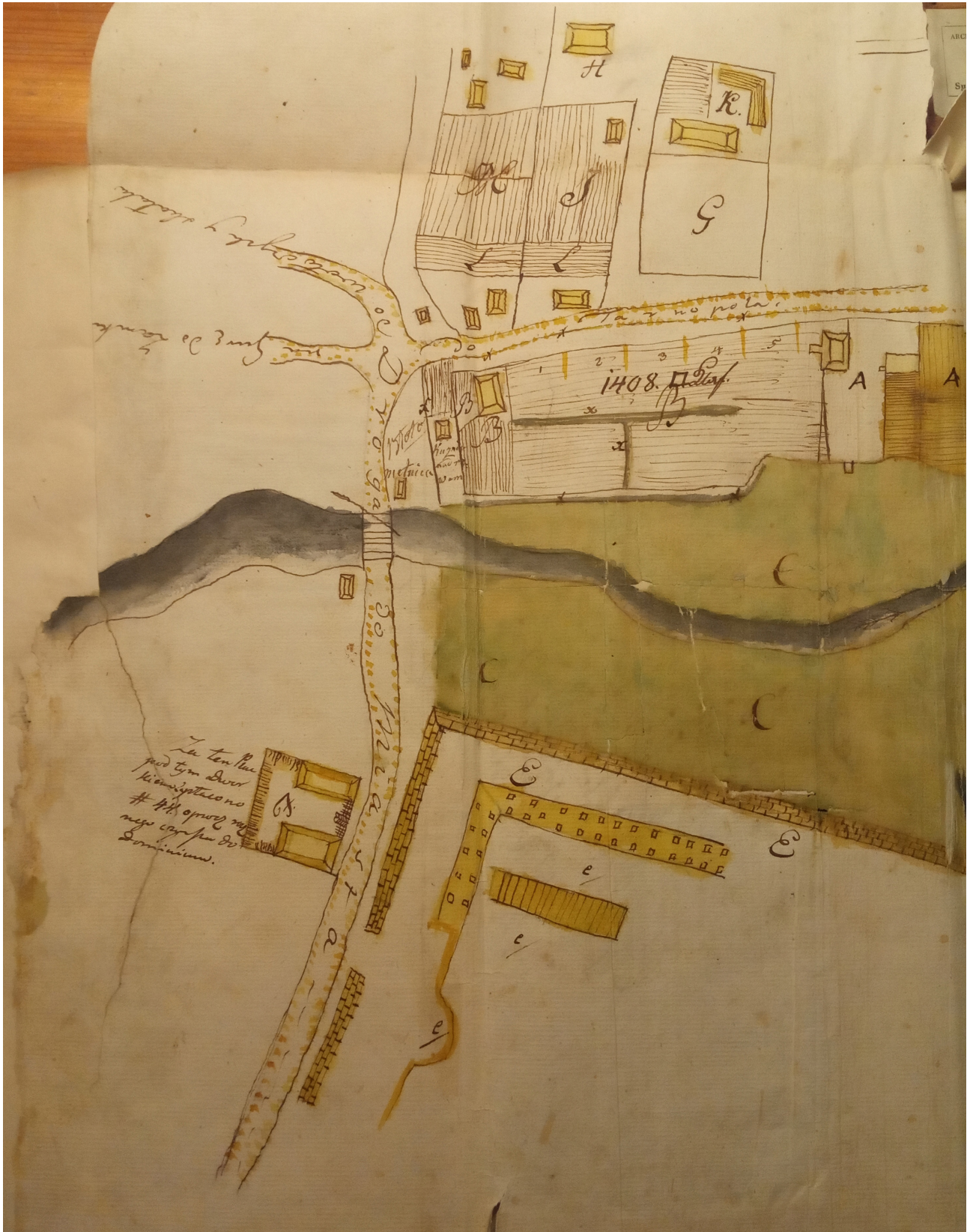
Рис. 1. Рукописна карта монастиря оо. Бернардинів у Збаражі 1792 р.