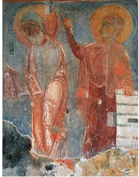
Мал. 4. Композиція «Стрітєння» зі Спасо-Преображенської церкви Польцька (за В. Сарабьяновим).

Для подібної за топографією 71 та сюжетністю фрески «Стрітєння» Спасо-Преображенської церкви Євфросиніївського монастиря (мал. 4), на думку В. Сарабьянова, характерне символічне приєднання до храмового вівтаря, що поєднує позачасовий символізм зображення з конкретністю богослужіння в храмі. Також він зауважував, що тема Спасіння людства є визначальною в іконографії сюжету 72 . Усе це можна сказати й про фреску київської пам'ятки, але з акцентом на персональне довгождане Спасіння 73 святого старця Симеона Богоприємця.