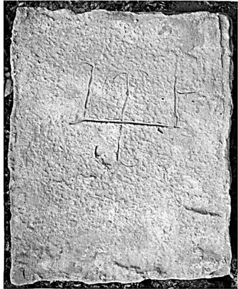
Мал. 2. Замальовка та фотографія плінфи зі знаком у вигляді тризуба.

Вище ми вже згадували примітку Філарета про різночитання в Єлецькому пом'янику «к. Всеволода кївського, во иноцѣхъ Кириллу» 47 та повідомлення М. Грушевського про копію синодика Київського історичного товариства із записом «великаго князя Всеволода кївського, въ иноцѣхъ Кирилла; великаго князя Георгія, убіеннаго в Кіевѣ» 48 . Також можемо долучити опубліковані 2007 р. свідчення з пом'яника Введенської церкви Києво-Печерської лаври, що донедавна майже не використовувалися дослідниками в наукових пошуках, а проте вирізняються повнотою подання інформації 49 .