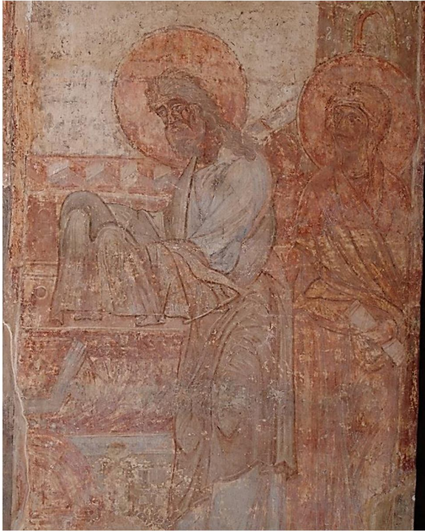
Мал. 5. Образи святого Симеона та Анни Пророкиці з композиції «Стрітєння» Кирилівської церкви.

Попередню думку підкріплює й те спостереження, що образу святого Симеона на південному вітарному стовпі приділено головну увагу, адже його фігура зображена в центрі та займає дві третини площини, а фігура святої Анни міститься буквально на маргінесі сюжету, її німб навіть заходить на червону розгранку (мал. 5). Оскоро зауважимо, що сувій із текстом у її руках згорнутий, тобто перебуває поза увагою у відтвореному символізм. У згаданій вище композиції «Стрітєння» половецької Спасо-Преображенської церкви таких деталей іконографії немає (мал. 4): обидві фігури займають однаковий простір, а сувій Анни Пророкиці відкритий для прочитання 74 .