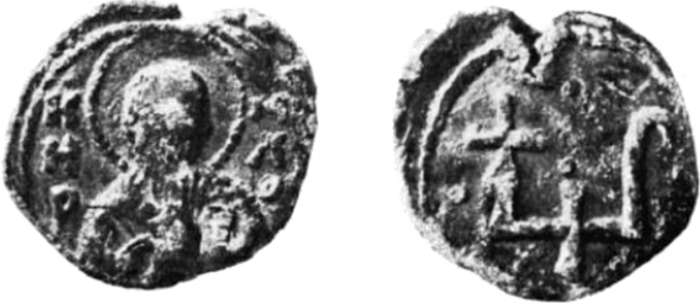
Мал. 1. Печатка з образом св. Кирила та двозубом (за М. Ліхачовим).

Ще одну печатку з образом святого Кирила, але вже з двозубом на звороті (мал. 1), М. Ліхачов аналогічно пов'язував із князем Всеволодом Ольговичем. Стосовно знака на печатці дослідник схилився до думки, що двозуб репрезентує родовий знак князя, але водночас зауважував, що таке визначення лишається гіпотетичним 30 .