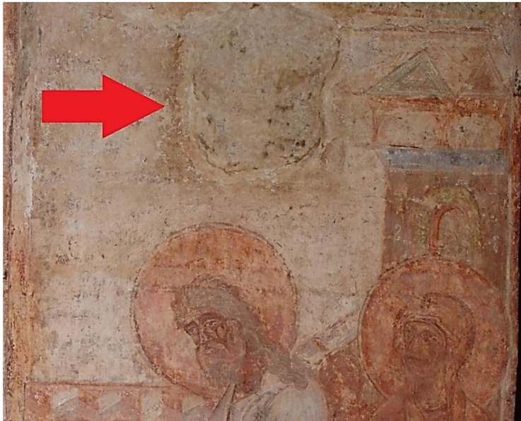
Мал. 6. Підмазка вапняним розчином над образом Симеона.

Вважаємо, що парадно прикрашений рушниковим орнаментальним фресковим розписом простір південної стіни передбачався для підйому князя Всеволода Ольговича на дерев'яний місток-перехід 80 до південного вітарного стовпа – щоб запалити лампаду біля головного образу храму. Показово, що над образом св. Симеона міститься нехарактерна для решти фрескового стінопису пам'ятки пізніша підмазка вапняним розчином (мал. 6), яка може приховувати місце кріплення кронштейна для підвісу-ланцюжка з лампадою.