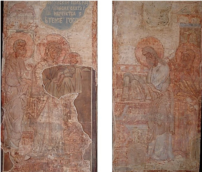
Мал. 3. Композиція «Стрітення» Кирилівської церкви Києва.

Літописи не називають хрестильного імені Всеволода Ольговича, а в матеріалах синодиків є тільки передсмертне християнське чернече ім'я Кирило, тому для подальшого дослідження пропонуємо залучити нашу гіпотезу щодо тотожності храму літописного монастиря Св. Симеона та споруди Кирилівської церкви Києва 68 . Повертаючись до того, що посвята храму має відповідати імені небесного патрона князя, як і його хрестильному імені, погляньмо на фресковий стінопис його київської церкви, який мусить певною мірою відбивати посвячення центрального вітаря та всієї церкви.