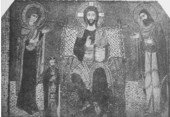
Рис. 9 Аналогія Т. Куделко до реконструкції композиції на південній стіні середньої кліті південної нави.

аналогій, які вона знайшла в монографії Н. Кондакова (Рис. 8, 9) 28 . До того ж така відповідність ґрунтувалася винятково на наявності на фресці решток двох німбів по обидва боки від Спасителя (Рис. 5), а образ жінки ліворуч, яка визирає з-за завіси архітектурної споруди (Рис. 6), було проігноровано 29 .