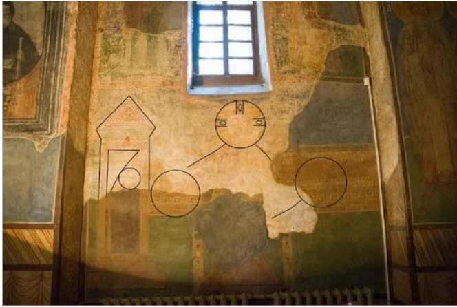
Рис. 5 Прорис складових давньої іконографії решток композиції на південній стіні середньої кліті південної нави.

Стінопис має численні різночасові механічні пошкодження, але залишки фрескового пігменту все-таки дають змогу розпізнати окремі складові давньої іконографії (Рис. 5). Так, майже в центрі композиції з незначним відхиленням праворуч давній майстер фронтально прописав фігуру Спасителя в червоному вбранні з хрещатим німбом. Збереглася лише верхня частина постаті. Нижче, по обидва боки від нього, — є фрагменти німбів двох інших постатей, зображення яких утрачено. Ще один образ прописано в крайній лівій частині композиції, він належить жінці з німбом, яка споглядає з-за завіси архітектурної споруди за Христом і двома його німбованими супутниками (Рис. 6).