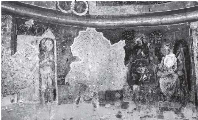
Рис. 11 Фреска «Старозавітна Трійця» («Гостинність Авраама») каппадокійської церкви Токалі-Кілісі в м. Гереме, Туреччина.

На наш погляд, яскравим прикладом такої іконографії композиції Старозавітна Трійця східного типу є композиція каппадокійської церкви Токалі-Кілісі в м. Гереме, Туреччина (Рис. 11). Безперечно, ця фреска належить до східних зразків іконографії Старозавітної Трійці, а розміщення святих образів на ній аналогічне сюжету фрески південної середньої кліті південної нави Кирилівської церкви, тобто так званій «ктиторській композиції» за визначенням дослідниці Т. Куделко.