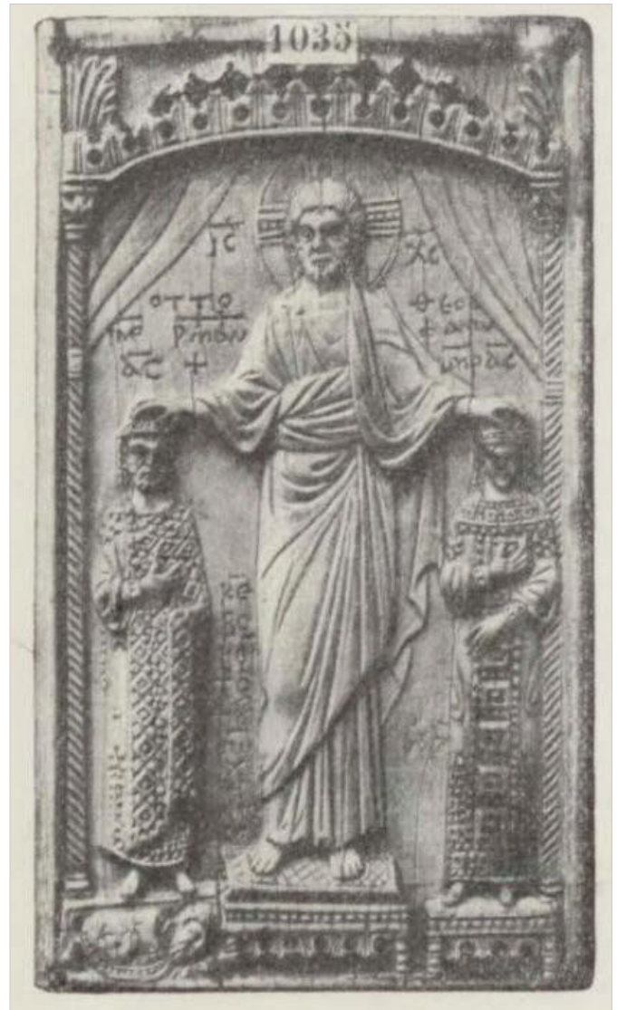
Рис. 8 Аналогія Т. Куделко до реконструкції композиції на південній стіні середньої кліті південної нави.

У 70-х рр. ХХ ст. рештки фрески розчистили з-під пізнішого олійного поновлення, що дало змогу досліджувати оригінальний стінопис (Рис. 2), але питання про реконструкцію давньої іконографії порушили значно пізніше.