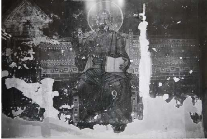
Рис. 7 Поновлення фрески олійними фарбами на південній стіні середньої кліті південної нави.

Прахов не зрозумів загальної іконографії, тож було вирішено обмежитися лише поновленням фігури Спасителя та архітектурних куліс з обох боків від нього 26 .