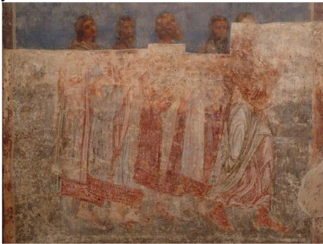
Рис. 4 Сюжет «Лик князів» композиції «Страшний суд». Поховальний портрет князівської усипальні.

можуть бути певні уточнення. На наш погляд, логічно припустити, що на цій фресці, найімовірніше, було зображено тих князівських осіб, яких давній майстер прописав на поховальному портреті «Лик князів» композиції «Страшний суд» нартексу храму (Рис. 4), тобто ктитора, князя Всеволода Ольговича, та трьох членів його роду 20 , для яких і було створено чотири ніші-аркосолії в усипальні пам'ятки 21 .