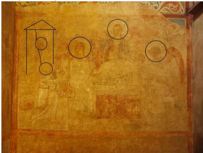
Рис. 10 Фреска «Старозавітна Трійця» («Гостинність Авраама») Софійського собору Києва.

Отож верхня частина так званої «ктиторської композиції» Кирилівської церкви за системою розміщення образів (Рис. 5) майже ідентична композиції «Старозавітна Трійця» («Гостинність Авраама») Софійського собору Києва XI ст. (Рис. 10) 39 .