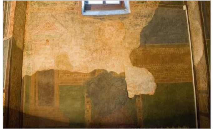
Рис. 2 Рештки фрескової композиції на південній стіні середньої кліти південної нави. Так звана «ктиторська композиція».

Напевно, найвагомим аргументом на користь бодай якоїсь участі княгині Всеволодої в ктиторських заходах, окрім опосередкованого свідчення літописного некролога, можна вважати так звану «ктиторську композицію» південної стіни середньої кліти південної нави (Рис. 2). Наш погляд на таку атрибуцію решток фрески цієї ділянки стисло викладено в раніше опублікованій статті 11 , тепер же зупинимося на цьому детально.