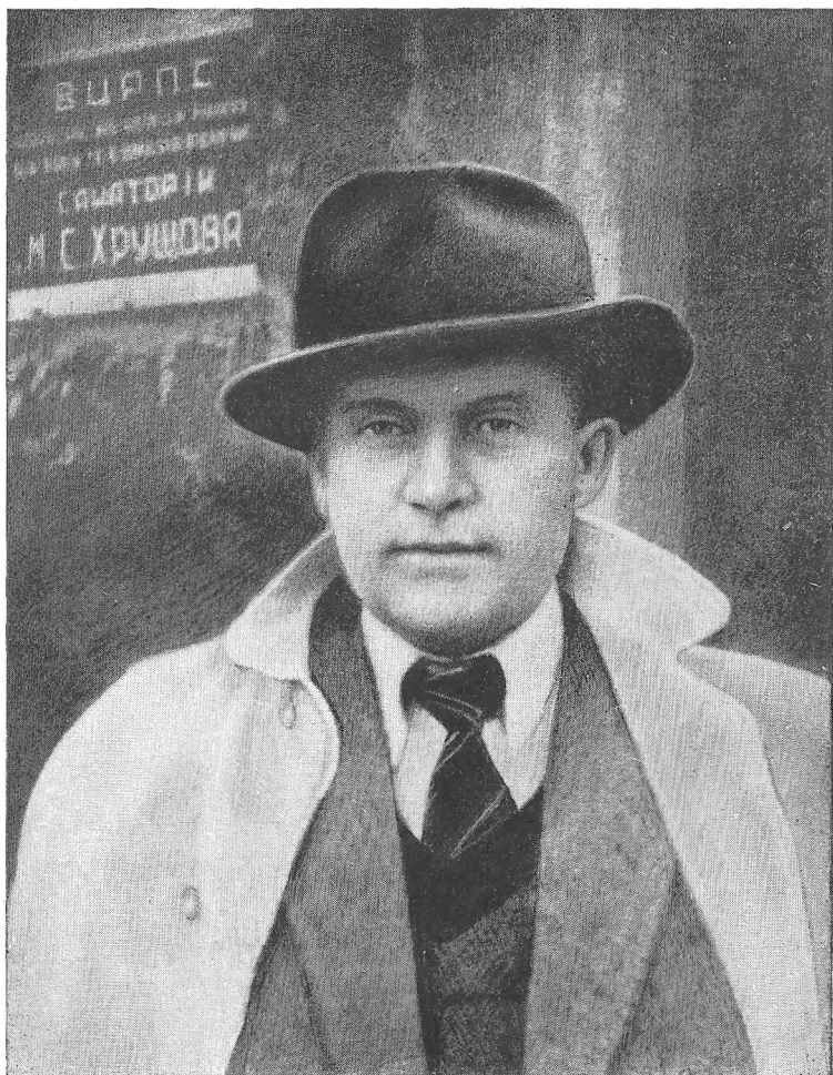
Я. Галан на відпочинку в санаторії ім. М. С. Хрущова (квітень 1949 р.)