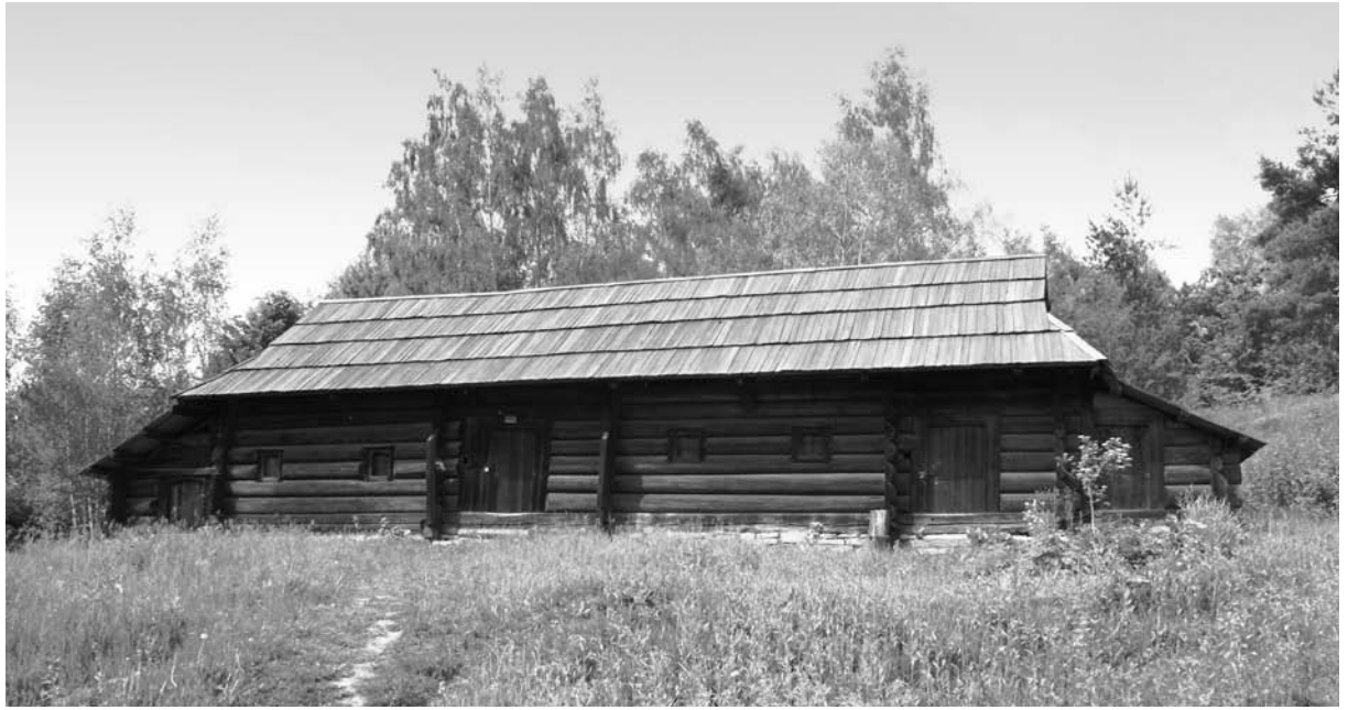
Хата із с. Березниця Верховинського р-ну Івано-Франківської обл. XVIII – середина XIX ст. Національний музей народної архітектури та побуту України.

“заміточками”. А ди?! Круглу форму печі укладали камінням. На припічках грілися діти, на піч старенькі було підуть деколи погрітися» [10].