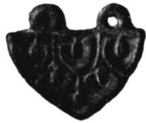
Рис. 5. Зображення «водної лілії» на накладці з Салтівського могильника.

Точне місце знахідки розглядуваної пам'ятки невідомо.