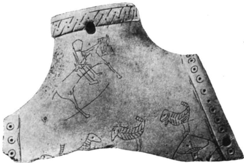
Рис. 2. Прорисовка гравірувальних зображень на роговому виробі.

Край устя закінчується потовщенням шириною 7 мм, прикрашеним крапками та навскісними штрихами, що ритмічно чергуються і утворюють враження крученого паска. Бокові отвори облямовані рельєфними стрічками шириною 8—10 мм з циркульним орнаментом. У нижній частині були зображені великі дуже стилізовані квітки, виконані ретельно і чітко гострим інструментом (рис. 2).