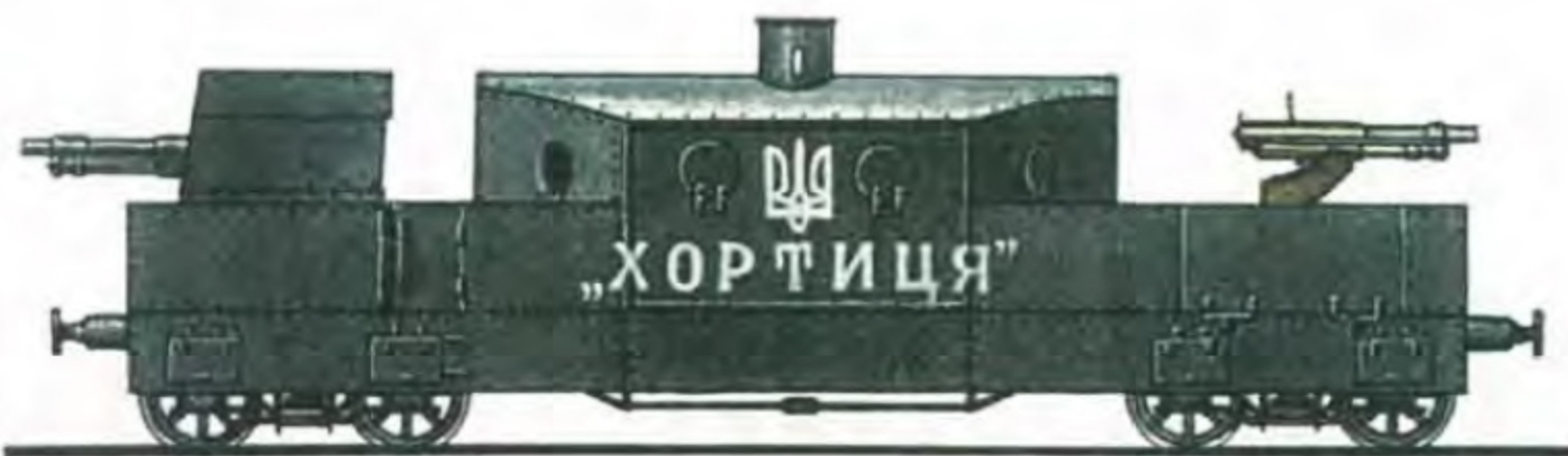
Кулеметно-артилерійська платформа панцирного потяга „Хортиця”

При формуванні бойових частин панцирних потягів паротяг ставили тендером уперед. Контрольні платформи розташовували одночасно попереду і позаду бойової частини. (На схемі не показані) Малюнки Тараса Штика