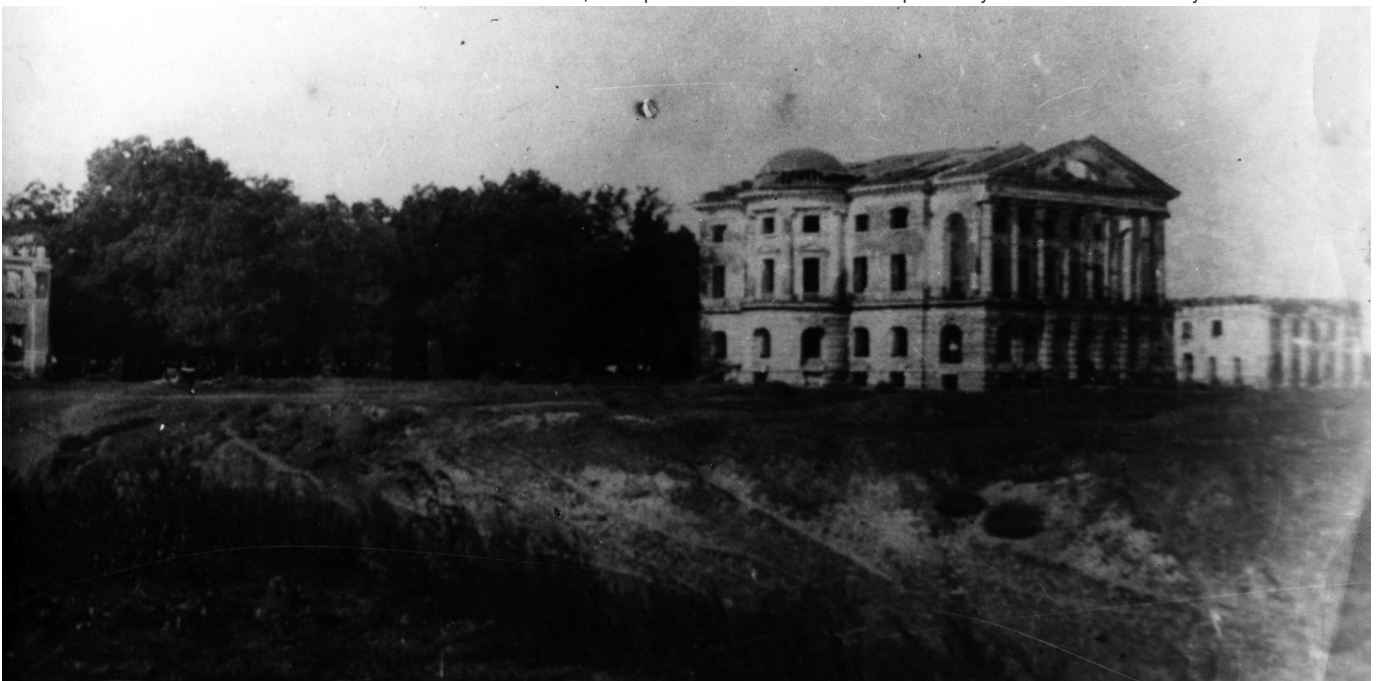
Палацово-парковий ансамбль гетьмана Кирила Розумовського. Фото початку ХХ століття.

Тож, як ми можемо зрозуміти, родина Розумовських крокувала в ногу з часом, а їхні садиби та палацово-паркові ансамблі у повній мірі є свідченням цим тенденціям.