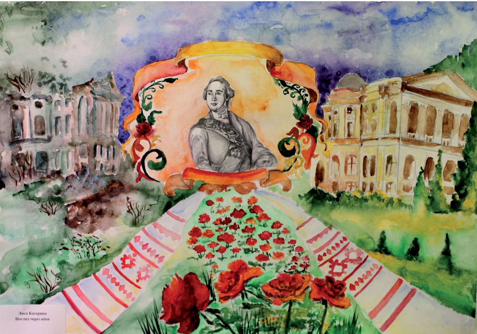
Лиса Катерина Погляд через віки