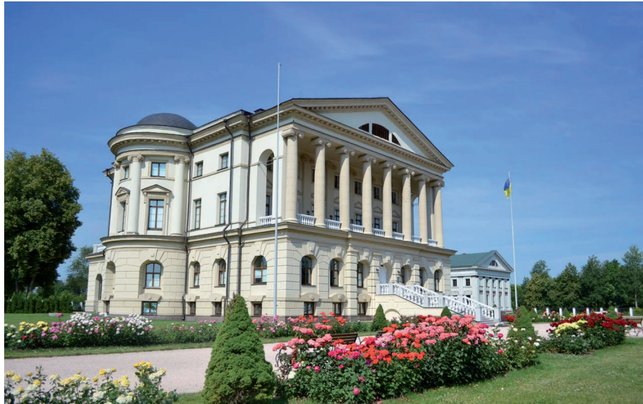
Палац Гетьмана Кирила Розумовського

Солодзько Яна «Багатогранне життя та діяльність Кирила Розумовського». Бахмацька загальноосвітня школа № 2. 2017 р.