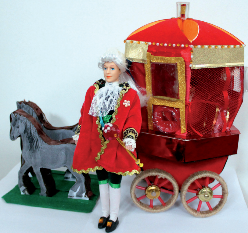
Колбик Кирило. Кирило на прогулянці. Батуринська загальноосвітня школа I-III ступенів ім. Григора Орлика. 2019 р.