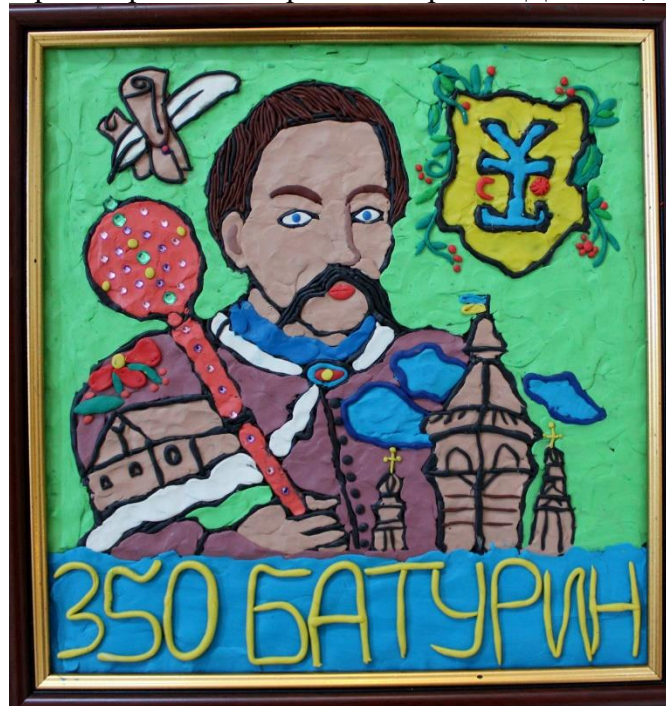
Рис. 3. Гетьман Іван Мазепа. Автор: Д. Семянов, м. Батурин. 2019 р