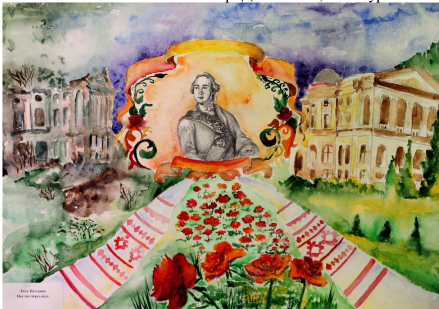
Рис. 4. Погляд через віки. Автор: К. Лиса, м. Конотоп. 2019 р.