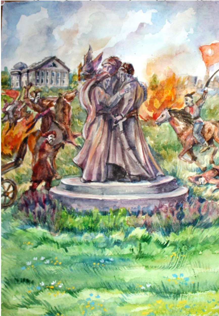
Рис. 6. Відлуння героїчних битв. Автор: В. Буренко, м. Конотоп. 2019 р.