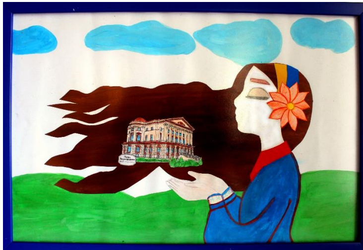
Рис. 2. Батурин – серце України. Автори: І. Токар та В. Дяченко, м. Конотоп. 2020 р.