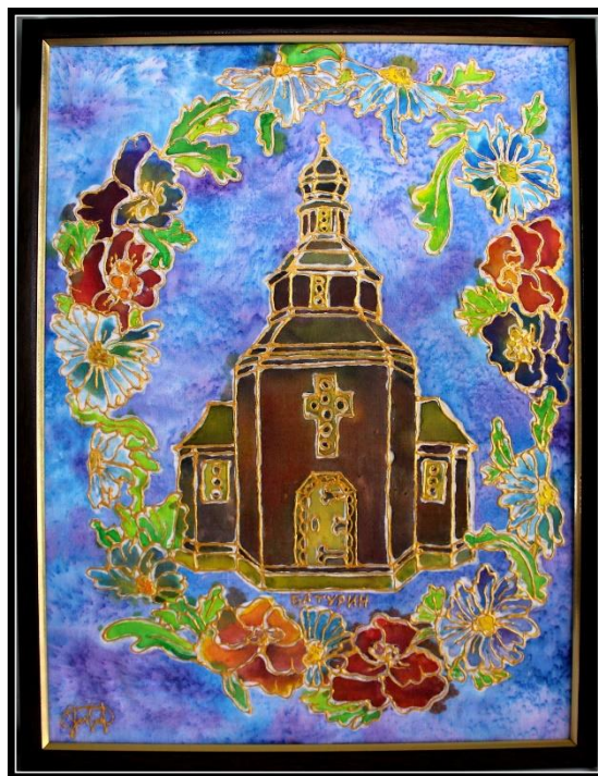
Рис. 1. Козацька церква з Батуринської фортеці. Автор: А. Москаленко, м. Кононоп. 2020.

Key words: Hetman Kyrylo Rozumovskyi Palace, competition «ROZUM-Fest», children, youth, National Reserve «Hetman's Capital».