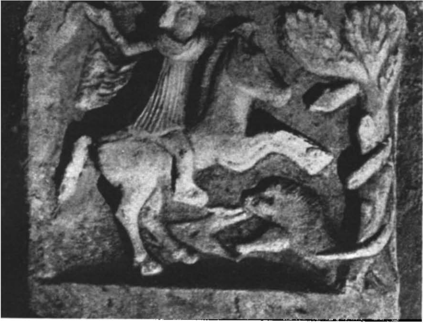
Рис. 1. Перший вапняковий рельєф.