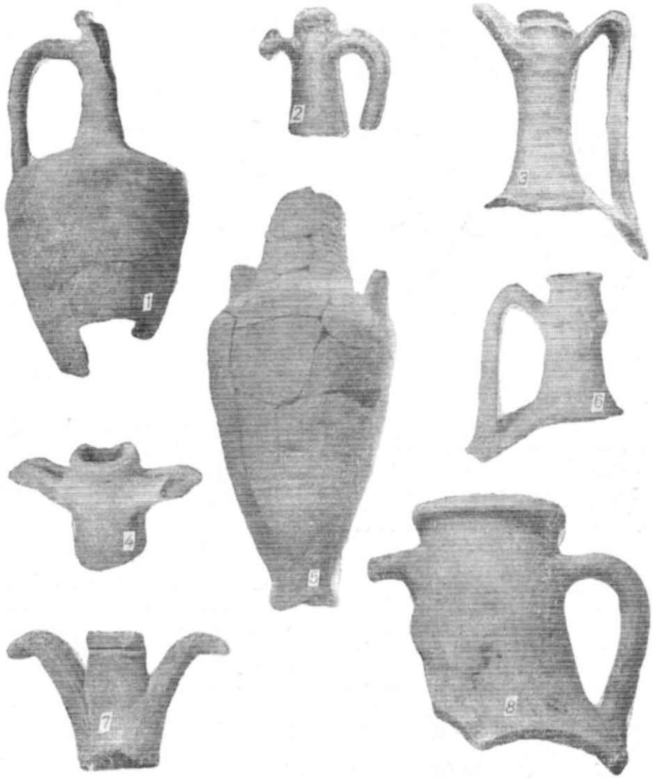
Табл. II. Типи амфор I—III ст. н. с. з Тіри.

краєм, горщиками з дрібним рифленням корпусу, невеликою горизонтальною ручкою на рівні краю, розчленованого пальцьовими вдавливами, горщиками сферичної форми та ін. Знайдені також кришки від горщиків та ручки сковорід. З дрібних керамічних виробів — знарядь праці трапилися пряслиця та грузила пірамідальної форми.