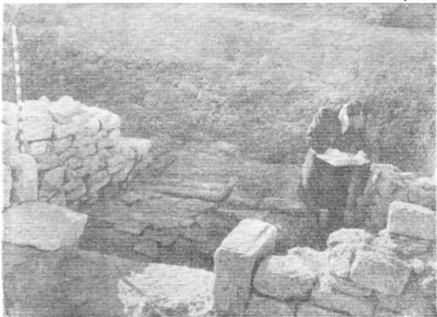
Рис. 2. Брукований дворик II—III ст. н. е.

Господарські ями пізнішого часу перерізали підлогу в приміщенні другого, північного будинку. Його два приміщення розташовані вздовж довгого боку двора — площею 25 м 2 , забрукованого невеликими плитковими каменями. В південно-західному кутку двора знаходився вбираючий колодязь діаметром 0,70 × 0,80 м, глибиною 2,5 м, куди за допомогою цього невеликого водостока відводилася дощова вода з двору. Виявлення цього комплексу також супроводжувалося знахідками речей перших століть нашої ери (фрагменти вузькогорлих амфор, червонолакові світильники та скляні посудини). На північ від цього будинку знаходилася згадувана вище гончарська піч.