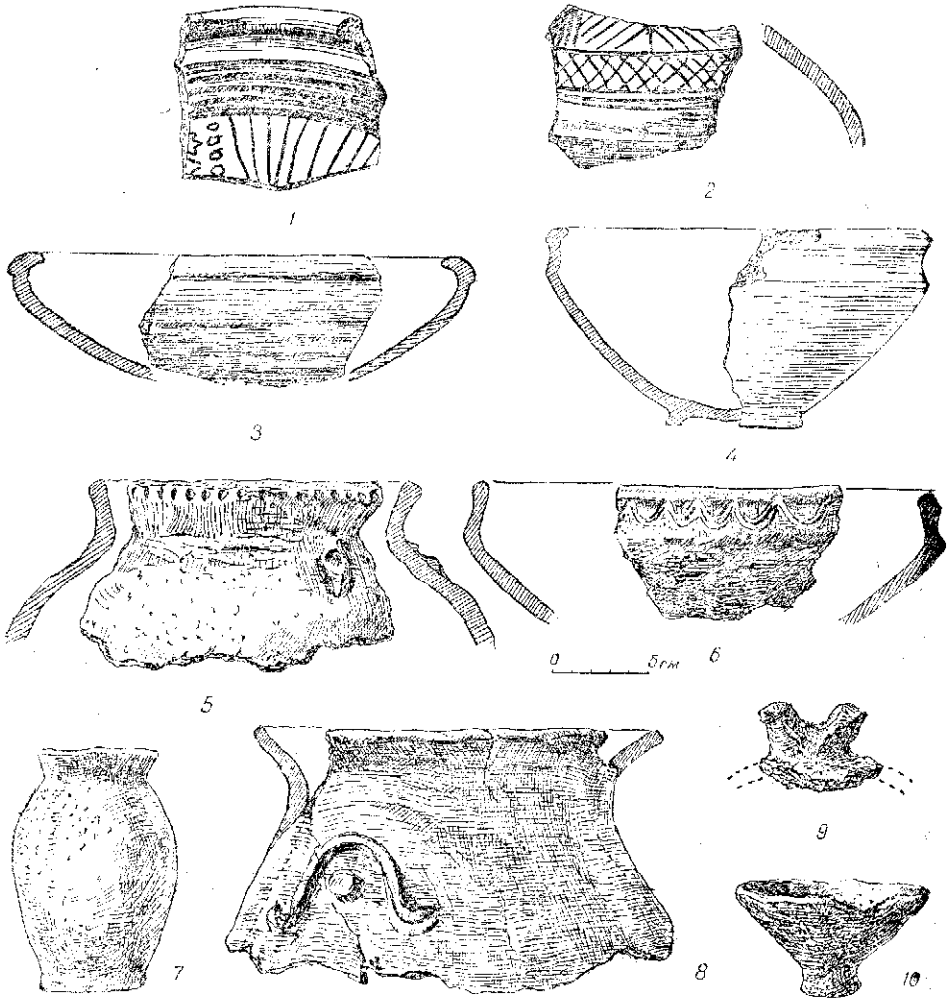
Табл. III. Тіра. 1—4 сіроглиняна лощена кераміка; 5—10 — ліпий посуд.

бортиком, скошеними до дна стінками, низькою кільцевою підставкою (табл. III, 4). На зовнішній поверхні є темносіре, блискуче лощення. 4. Глеки амфоровидної форми, з двома ручками, коротким горлом, низькою кільцевою підставкою. 5. Одноручні глеки з біконічним корпусом. Зустрічаються глеки і з ребристим горлом. Найчастіше на цих посудинах зустрічається орнамент у вигляді горизонтальних і вертикальних