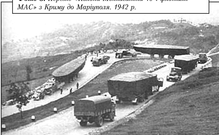
Фото 8. Перехід «Колони Моккагатта 10-ї флотилії МАС» з Криму до Маріуполя. 1942 р.

морської блокади Севастополя. Подібні сили радянського ВМФ на Чорноморському театрі застосовувалися обмежено наприкінці війни, а німецького – взагалі участі не брали.