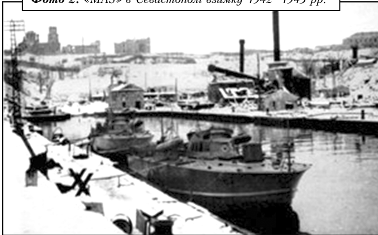
Фото 2. «MAS» в Севастополі взимку 1942–1943 рр.

Активні дії італійської флотилії відмічаються в період з квітня 1942 р. по травень 1943 р., в ході якого було здійснено