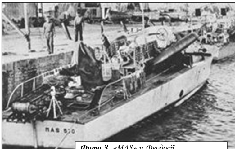
Фото 3. «MAS» у Феодосії

18 червня 1942 р. два торпедні катери «MAS» атакували самохідні баржі, що перевозили війська до Севастополя. У цьому бою був потоплений радянський транспорт (назва знов не наводиться – прим. авт.) [18]. В інших джерелах чітко вказано назву потопленого судна, дату, час, місце та причину його загибелі, зокрема: «... теплохід «Белосток» затонув в районі мису Фіолент поблизу Севастополя, в результаті торпедування італійськими торпедними катерами в ніч з 18 на 19 червня 1942 р.» [26]. Слід також відмітити, що в [27] вказується про