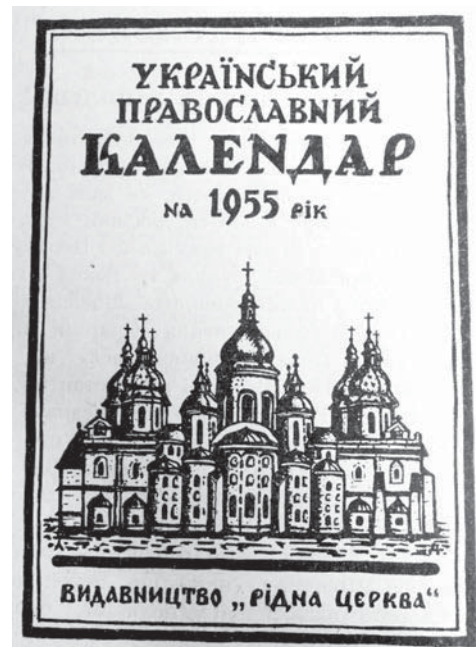
Титульна сторінка українського православного календаря на 1955 рік кишенькового формату.