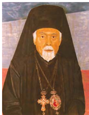
Світлина митрополита Анатолія Дублянсько-

Окупація України у 1944 році радянськими військами змусила залишити Батьківщину та податися в еміграцію велику кількість людей, серед яких були ієрархія, духовенство та віряни УАПЦ. Емігрував також і Анатолій Захарович Дублянський (пізніше – митрополит Анатолій), про що дізнаємося з його автобіографії «Шляхи мого життя» 4 . Приймаючи активну участь у формуванні церковно-релігійного життя закордоном, Анатолій Захарович розпочав також збирати свою власну бібліотеку і таким чином за майже 50-літній період перебування в Німеччині