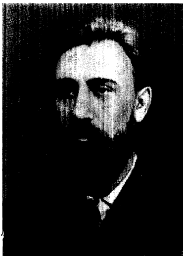
Н. І. Кобринська. Фото. 90-ті роки Б. Д. Грінченко. Фото. 1889