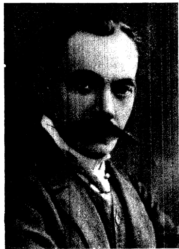
В. Г. Шурат. Фото. 900-ті роки