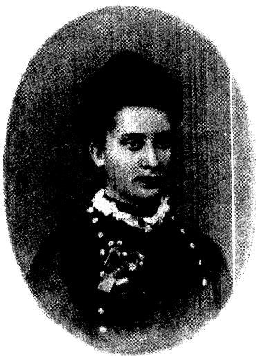
Еліза Ожешко. Фото. 900-ті роки