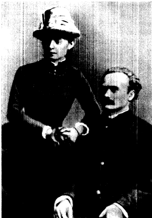
І. Я. Франко та О. Ф. Хоружинська. Фото. 1886