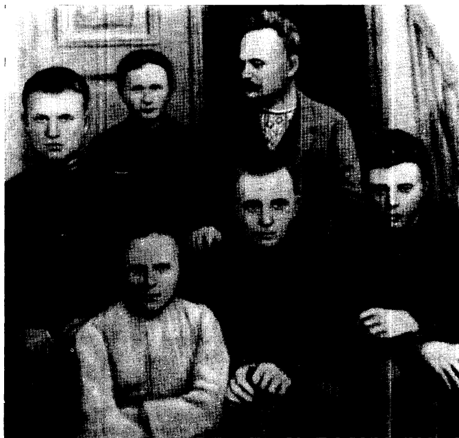
І. Я. Франко з дружиною О. Ф. Франко та дітьми — синами Андрієм, Тарасом, Петром та дочкою Анною. Фото. 1902