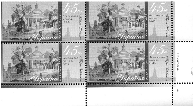
Рис. 6. Блок марок поштових «Аскольдова могила» серії «Київ очима художників». Україна, 2002 р. (ФІЛ-2018-2021).

2001 р. був виданий конверт на честь 12-річчя відновлення Тернопільського обласного Товариства української мови ім. Т. Шевченка, заснованого у 1868 р. в Галичині.