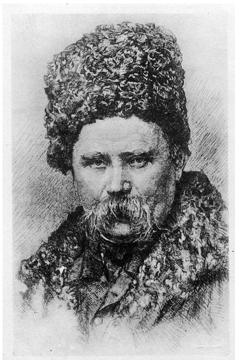
Рис. 4. Картка поштова з портретом Т.Г.Шевченка. Худ. В. Мате (за автопортретом Т. Шевченка). РСР, Москва, 1939 р. (ФК-1032).

1939 р. була надрукована художня картка з гравюри В. Мате (1856–1966), що відтворює фотографію А. Деньєра, де Т. Шевченко представлений в шапці зі смушка і в кожусі (рис. 4).