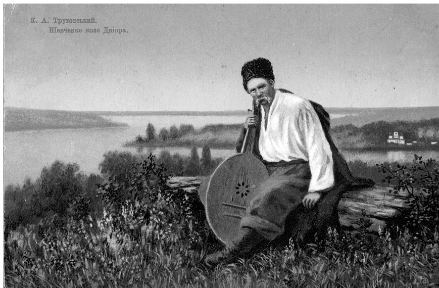
Рис. 3. Картка поштова «Шевченко коло Дніпра». Російська імперія, поч. ХХ ст. (ГРЛ-3598/40).

На початку 1920-х рр. Київський музей революції з нагоди святкування пам'яті Тараса Григоровича видав так багато поштових карток [1, 185–187], що потім їх нереалізовані екземпляри у музеї використовували як каталожні картки. На цих картках зображені хата, де народився Кобзар, і поет на засланні в Орській фортеці (рис. 2).