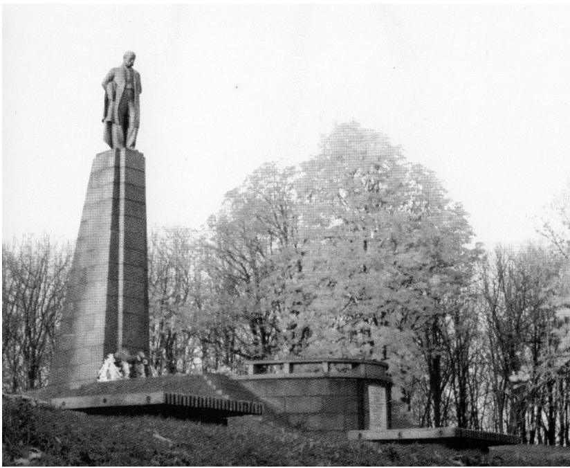
Рис. 9. Картка поштова «Пам'ятник Т.Г. Шевченку». Україна, Канів, 2010-і рр. (ФК-1474).

Інші поштові картки з колекції НМІУ (ГРЛ-3598/38; ФІЛ-306, ФІЛ-1254-1255; ФК- 1474) зображують краєвиди Канева та пам'ятник Т. Шевченку, встановлений в 1939 р. скульптором М. Манізером. Завдяки цим карткам, конвертам та маркам можна простежити історію місця, де було поховано Т. Шевченка: від чавунного пам'ятного хреста (ГРЛ- 3598/38) до сучасного пам'ятника (рис. 8, 9).