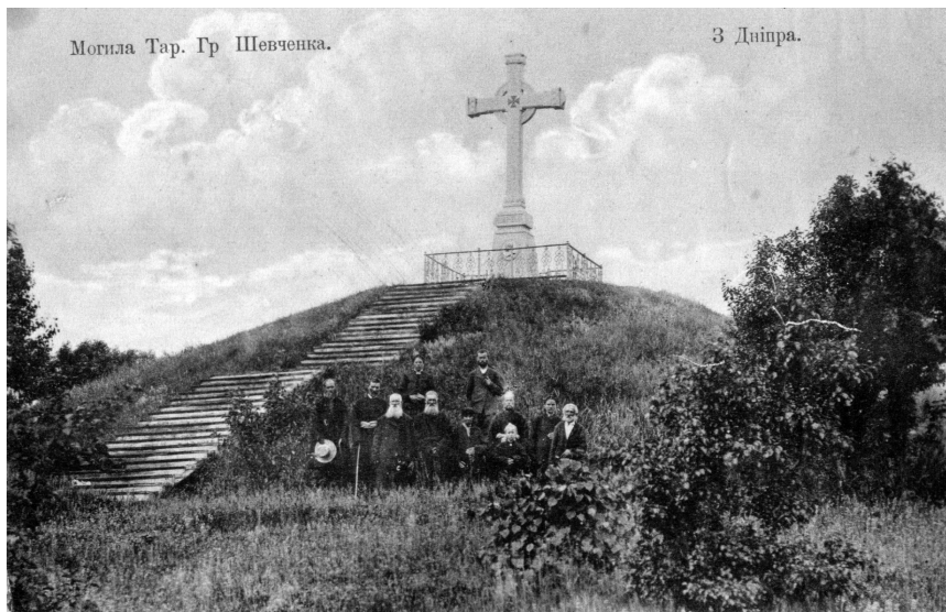
Рис. 8. Картка поштова «Шевченківська могила у Каневі». Поч. ХХ ст. (ГРЛ-3598/38).

2007 р. вийшла марка з одним з перших автопортретів Кобзаря (ФІЛ-1920), написаним в 1840 р. [6, 11]. На поштовому блоці 2013 р. «Автопортрет» (ФІЛ-2580) бачимо Т. Шевченка на засланні в Орську.