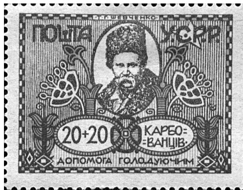
Рис. 1. Марка поштово-добродійного випуску «Допомога голодуючим». Худ. О. Моренков. УСРР, червень 1923 р. (ФІЛ–1861).

У колекції НМІУ у групах «Філокартія» (ФК), «Філателія» (ФІЛ) і «Гравюра та літографія» (ГРЛ) зберігається 35 творів шевченкіани. Поштові художні картки та марки, присвячені Кобзарю, за змістом можна поділити на оригінальні художні твори (ФК–593, ФК–1461, ФК–1462, ФК–1032, ФК–1530; ФІЛ–303, ФІЛ–329, ФІЛ–364, ФІЛ–432, ФІЛ–800, ФІЛ–857, ФІЛ–1091, ФІЛ–1211, ФІЛ–1155, ФІЛ–1257, ФІЛ–1861; ГРЛ–3598/40); репродукційні – відтворення творів живопису і графіки Шевченка (ФІЛ–747, ФІЛ–1918, ФІЛ–1919, ФІЛ–1920, ФІЛ–2018–2021; ГРЛ–3591/2) та фотонатурні – фотографії шевченківських місць (ФК–14, ФК–1021, ФК–1474; ФІЛ–306, ФІЛ–382, ФІЛ–1255, ГРЛ–3598/38).