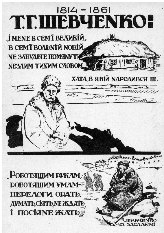
Рис. 2. Картка поштова «Т.Г. Шевченко. 1814–1861». УРСР, 1920-ті рр. (ФК-1530).

1923 р. була випущена перша поштова марка УСРР з портретом Т. Шевченка номіналом 20 крб. та написом «На допомогу голодуючим» (рис. 1). Частина коштів, перерахованих з продажу, йшла на допомогу українцям, котрі постраждали від неврожаю. Марка виконана в теплій коричневій гамі, а портрет поета оточений традиційним українським рослинним орнаментом.