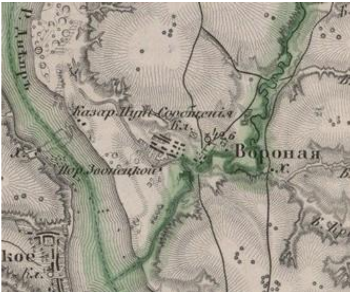
Рис. 3. Військово-топографічна карта Катиринославської губернії, фрагмент, (Военно-топографическая карта..., 1861, ряд XXVI, арк. 13)

За наказом Х. фон Мініха від 22 квітня 1736 р., між річками Самарою та Вороною мали «заложити в удобном месте еще один редут, в котором, по размотрению, определить людей, удела из прочих». Про це було повторно наголошено і в наказі, виданому наступного дня (Байов, А. К., ред., 1904, сс. 12–14). Через цей редут мало підтримуватися сполучення між ретраншементом Усть-Самарським і шанцем Вороним.