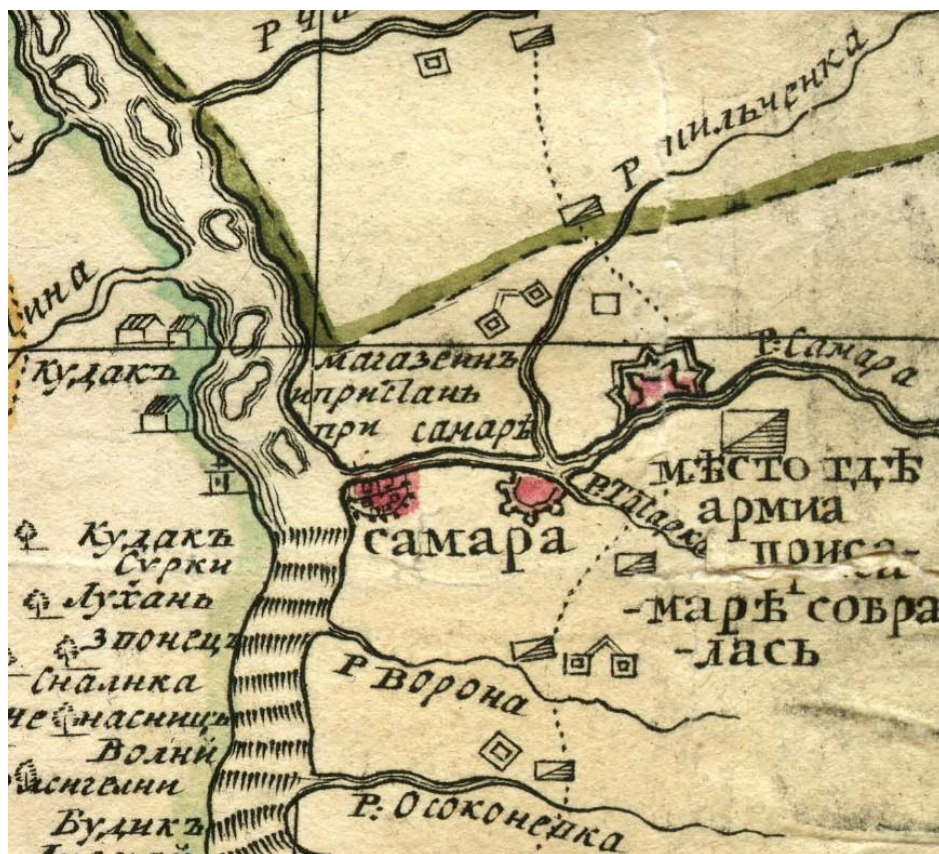
Рис. 1. «Карта предпринятых в 1736 году от Армии Ея Императорского Величества против турок и татар победоносных военных действий между Доном и Днепром и при оных реках», фрагмент (РДАДА. Ф. 192. Оп. 1. Спр. 12. Ч. 2)