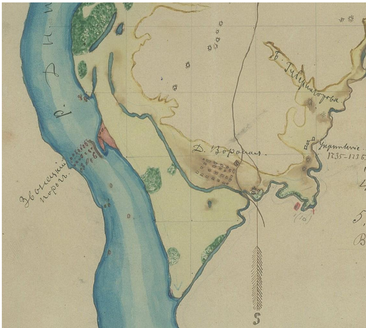
Рис. 2. «План земли Вороновской, Новомосков. с нанесением курганов», фрагмент (ДНІМ. Арх. № 814/КН-38802)

на правому березі Самари, на правому мисі гирла її правої притоки р. Кринка (Кримка), на місці колишньої Новобогородицької (Богородицької) фортеці кінця XVII – початку XVIII ст.; ретраншемент Самарський (Піщана Самара), на правому березі Самари біля броду Піщаного; ретраншемент Монастирський, на місці Самарського Сергіївського монастиря. Головним з цих укріплень був ретраншемент Усть-Самарський (Байов, А.К., 1906, сс. 235–236; Ласковський, Ф.Ф., 1865, сс. 344–346; Маріна З.П., Філімонов, Д. Г., 2009, сс. 67–69; Філімонов, Д., 2006, сс. 43–44).