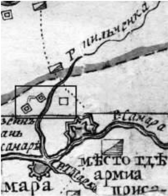
Рис. 1. Фрагмент карти військових дій 1736 року з позначенням фортифікаційних споруд на берегах р. Кільчень (РДАДА, 1736)