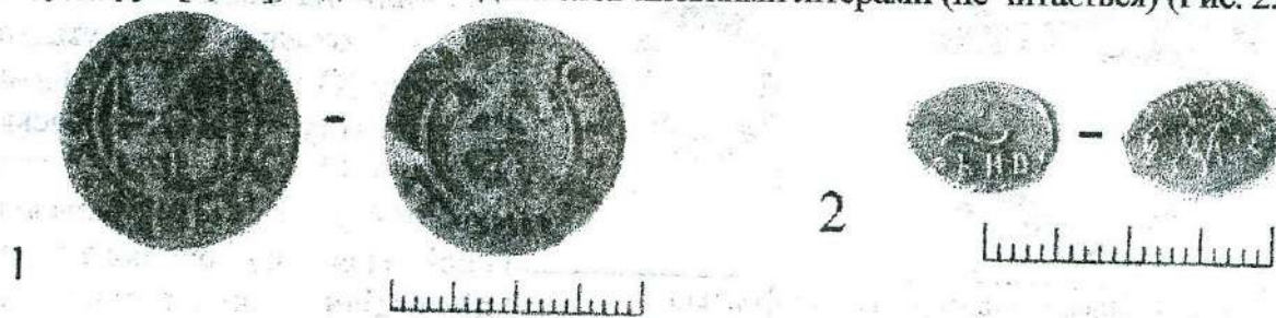
Рис. 2. Посад Новосергіївської фортеці.

Друга монета – срібна копійка періоду правління царя Петра Олексійовича зразка 1696–1704 рр., карбована на Старому монетному дворі у Москві. На лицьовому боці міститься фрагмент напису «ЦАРЬ И ВЕЛИКИЙ КНЯЗЬ ПЕТР АЛЕКСЕЕВИЧЬ ВСЕЯ РОССИИ» [10, 6]. На зворотному – частина зображення коронового вершника зі списом праворуч [9, 15], під конем – дата слов'янськими літерами (не читається) (Рис. 2.2).