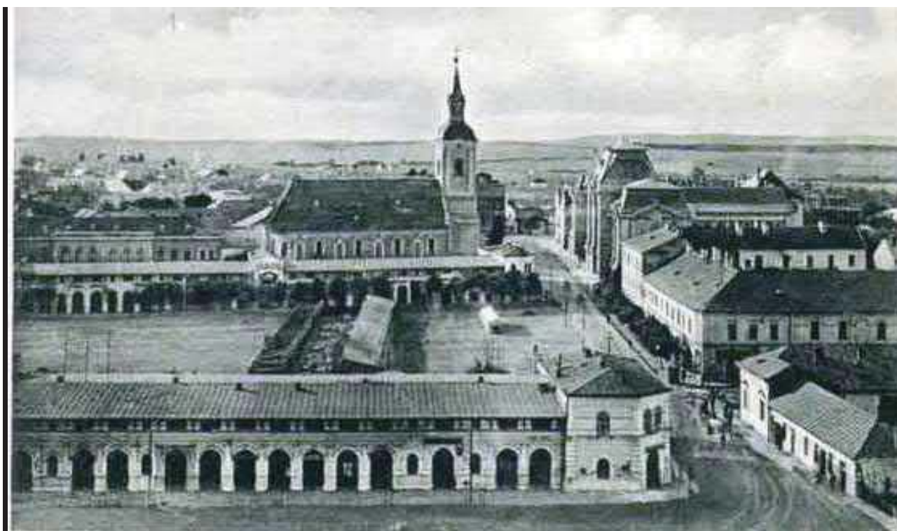
Рис. 3. Ринкова площа та реформатська церква в Берегові на початку ХХ ст. (ймовірне місце францисканського монастиря), [ https://karpatalja.ma/sorozatok/karpatalja-anno/karpatalja-anno-ilyen-volt-a-beregszaszi-hosok-tere/ (дата звернення 23.04.2021)].