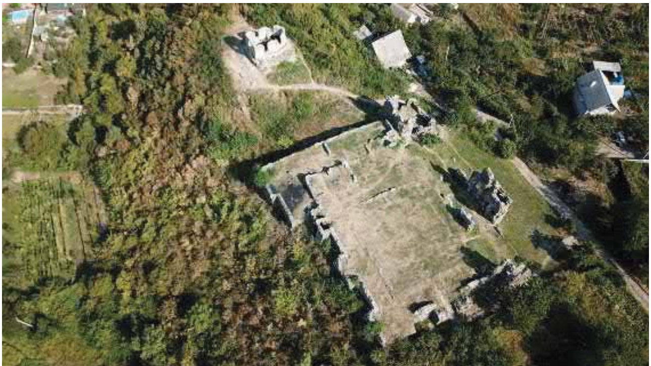
Рис. 2. Руїни замку Канко (сучасний вигляд)